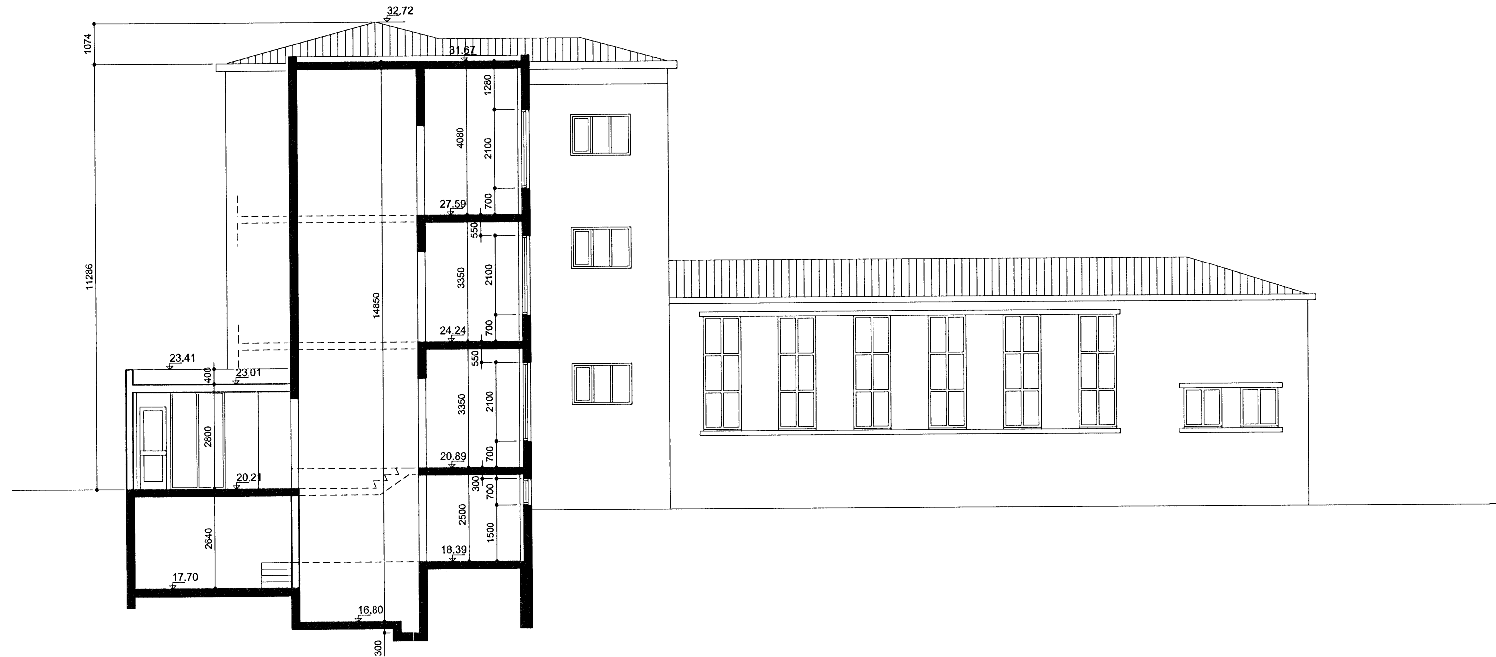
SKURÐMYND A-A MKV 1:100