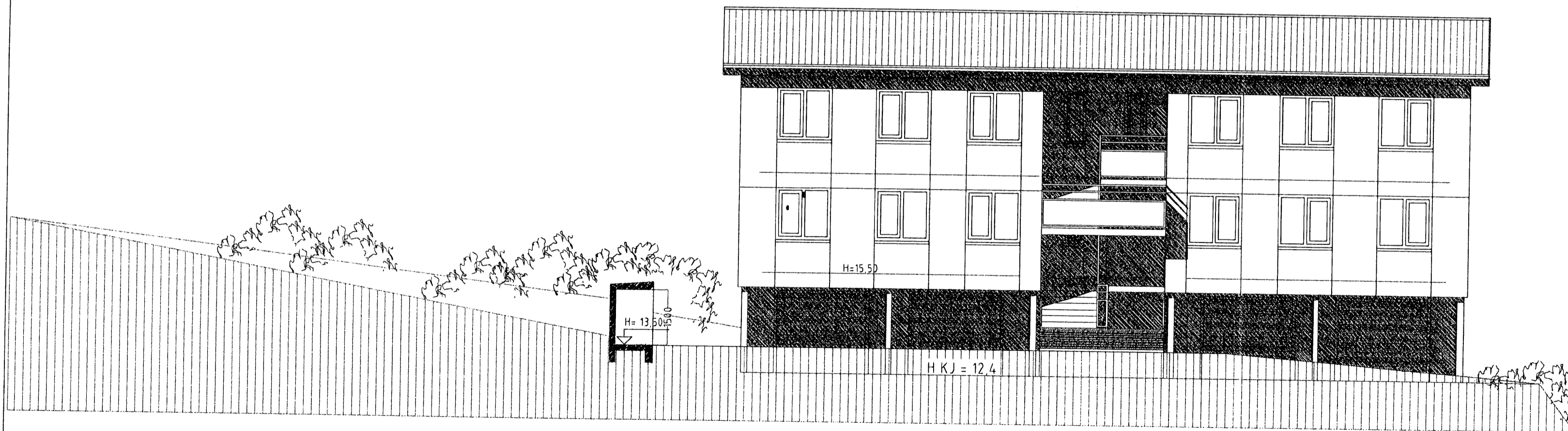
ÚTLIT AUSTUR. mkv. 1:100.

Teikning þessi er fengin hjá Sigurði Þorvarðarsyni. Hún var samþykkt af byggingarfulltrúanum í Hafnarfirði (fh. G. Valtýsd.) 4. Okt. 2002.