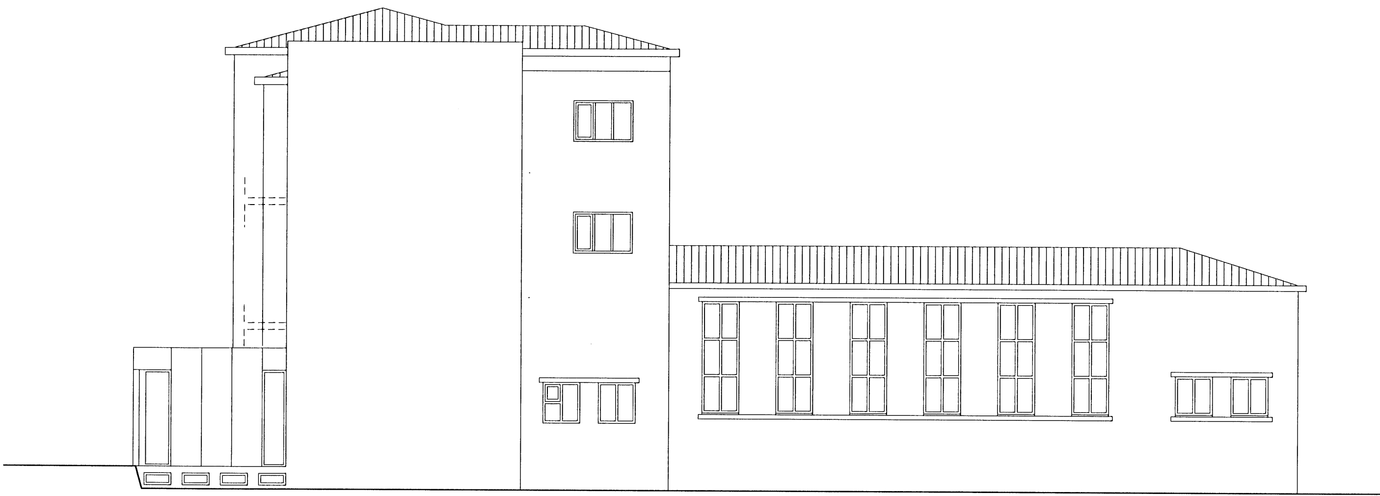
ÚTLIT NORÐAUSTUR MKV 1:100