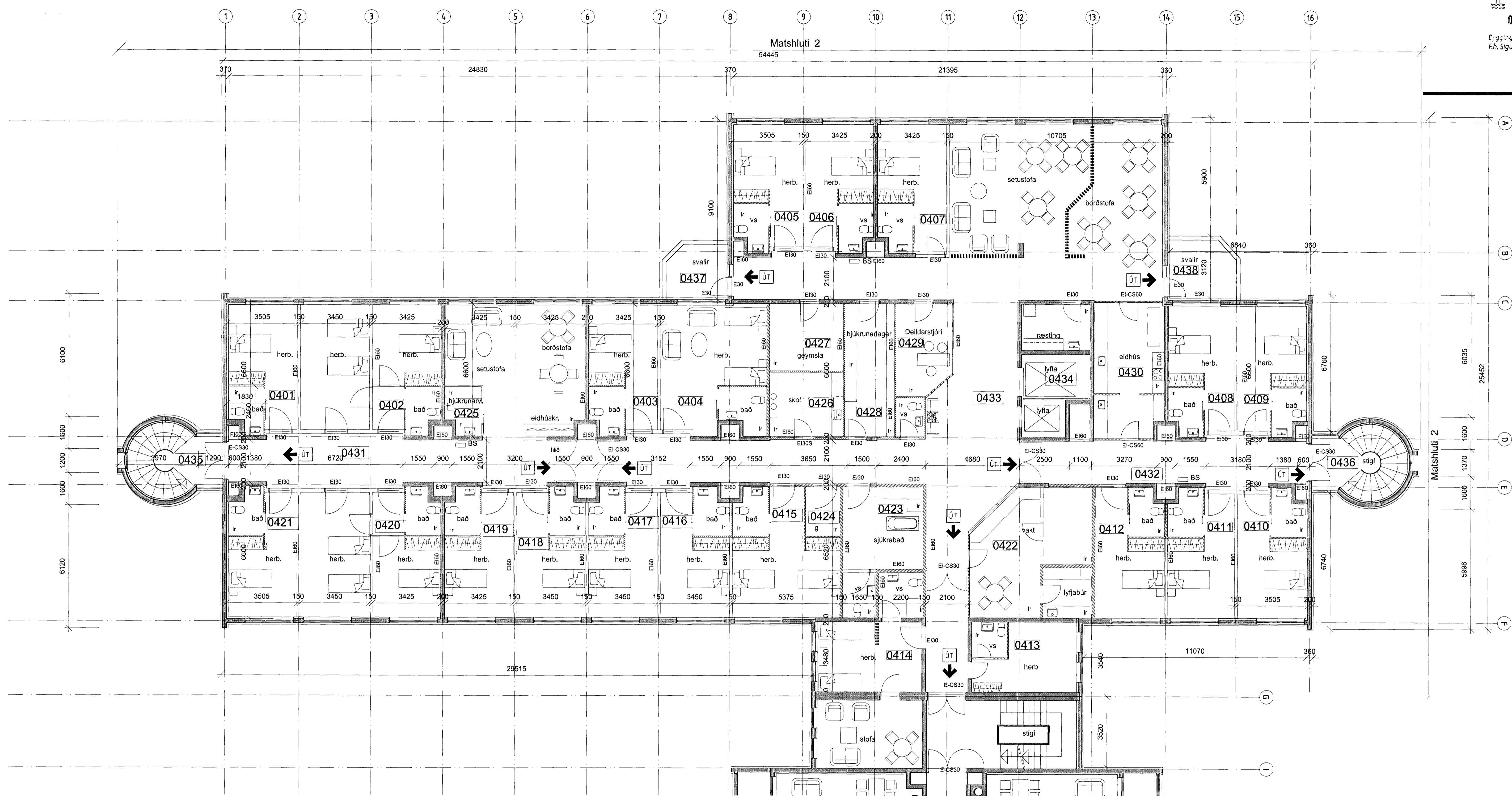
GRUNNMYND 4. HÆÐ B-HÆÐ 1:100