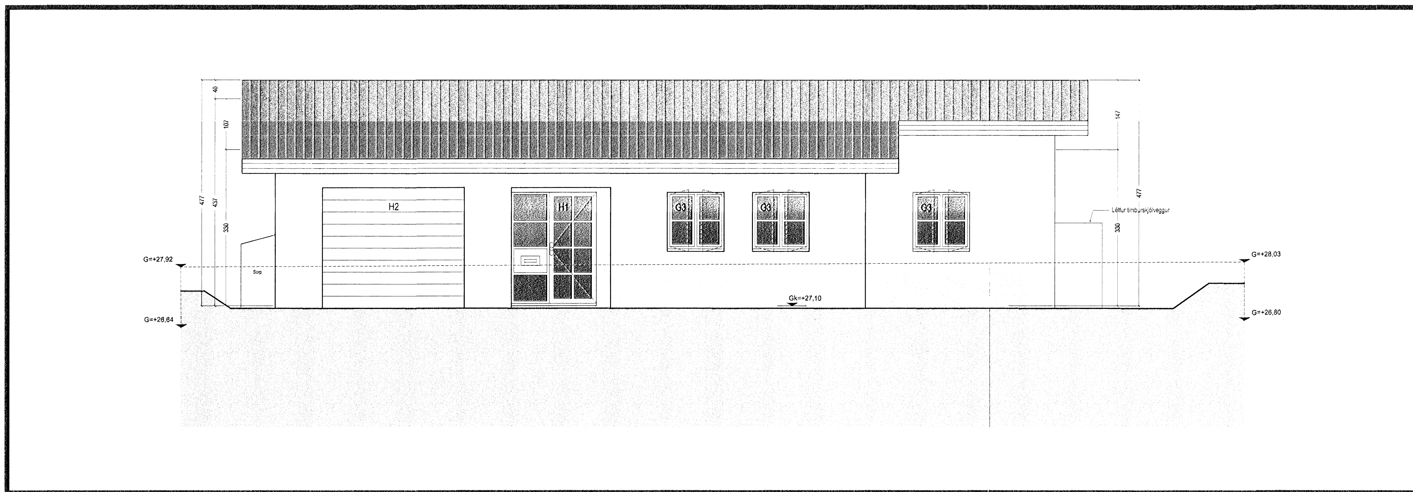
Norður útlit 1:50