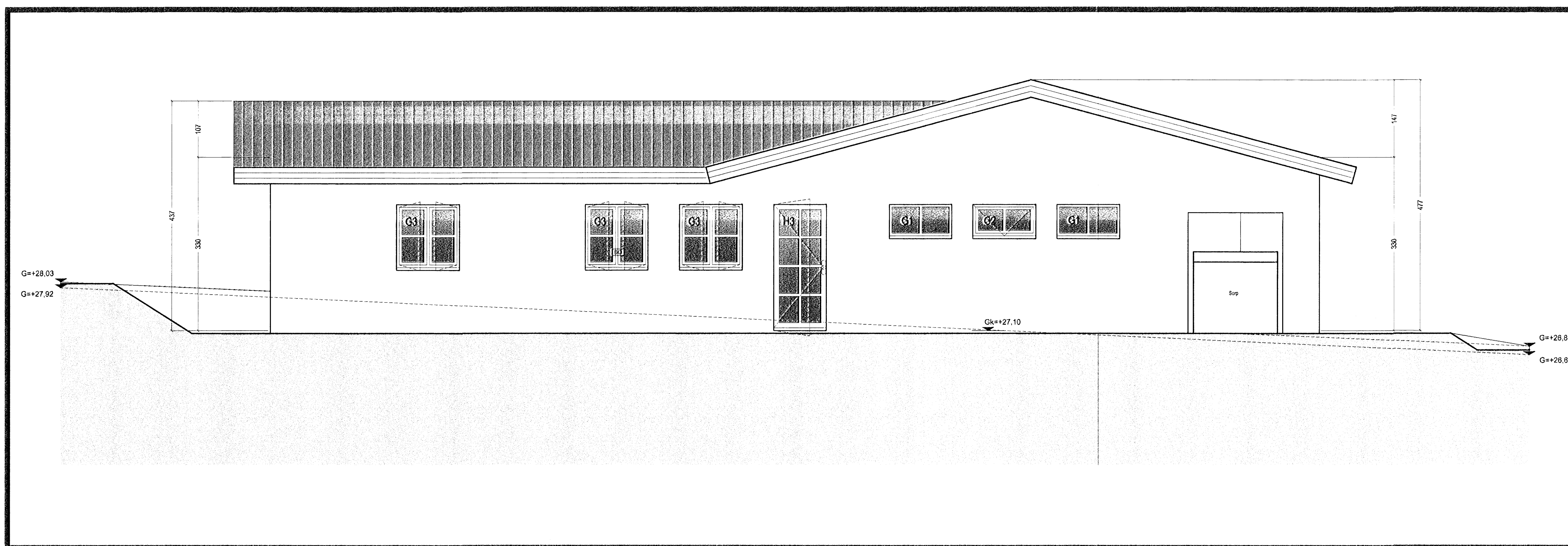
Austur útlit 1:50