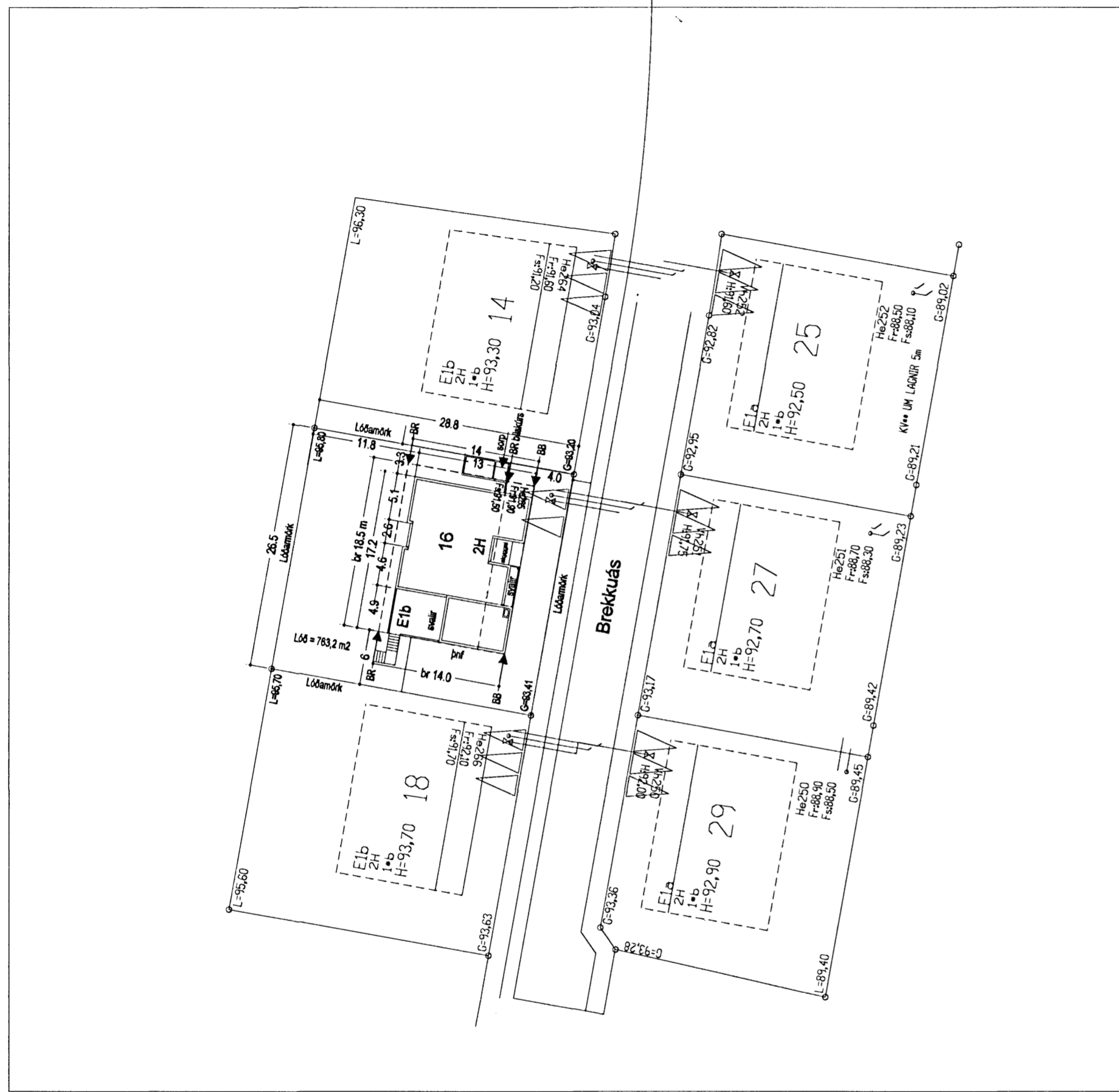
AFSTÖÐUMYND mkv. 1:500

Allur frágangur eldstæðis og arinþípu sé í samræmi við ákvæði byggingarreglugerðar sbr. gr. 192 og 193 sem og leiðbeiningar Brunamálastofnunar.