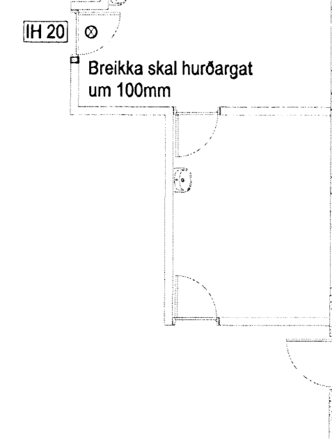
1 GRUNNMYND 1. HÆÐ - NIÐURRIF VEGGJA OG HURÐA 1:100

AUKARÝMI Á HJÚKRUNARHEIMILI AÐGEGNI Í GEGN UM GANG FRÁ HEILSUG/ESLU