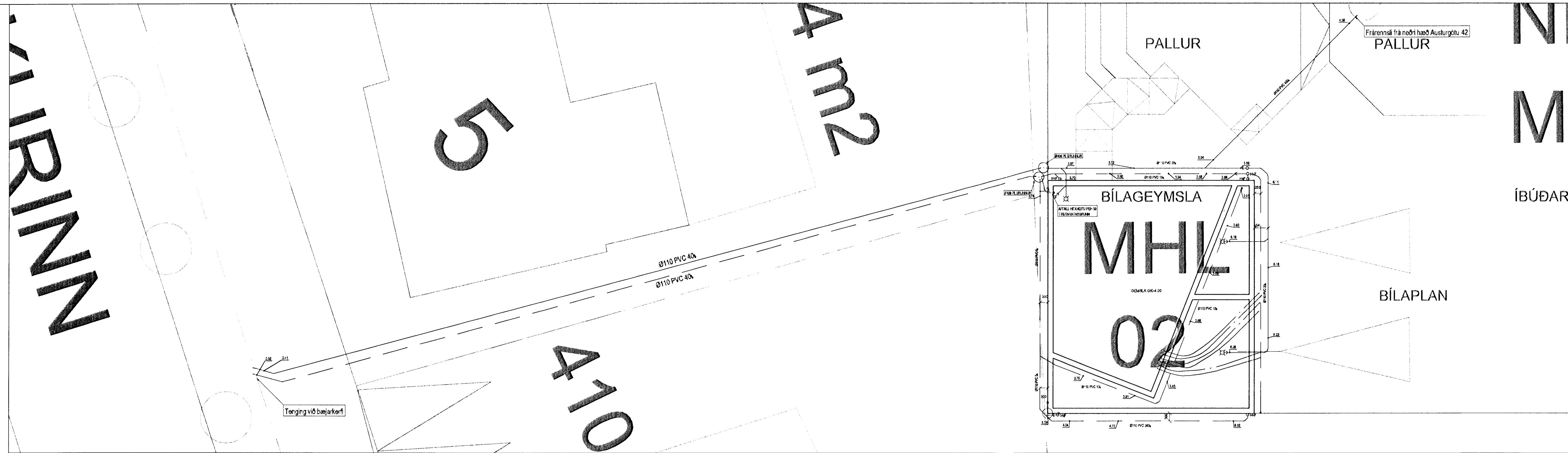
AFSTÖÐUMYND GRUNNLAGNA 1:100