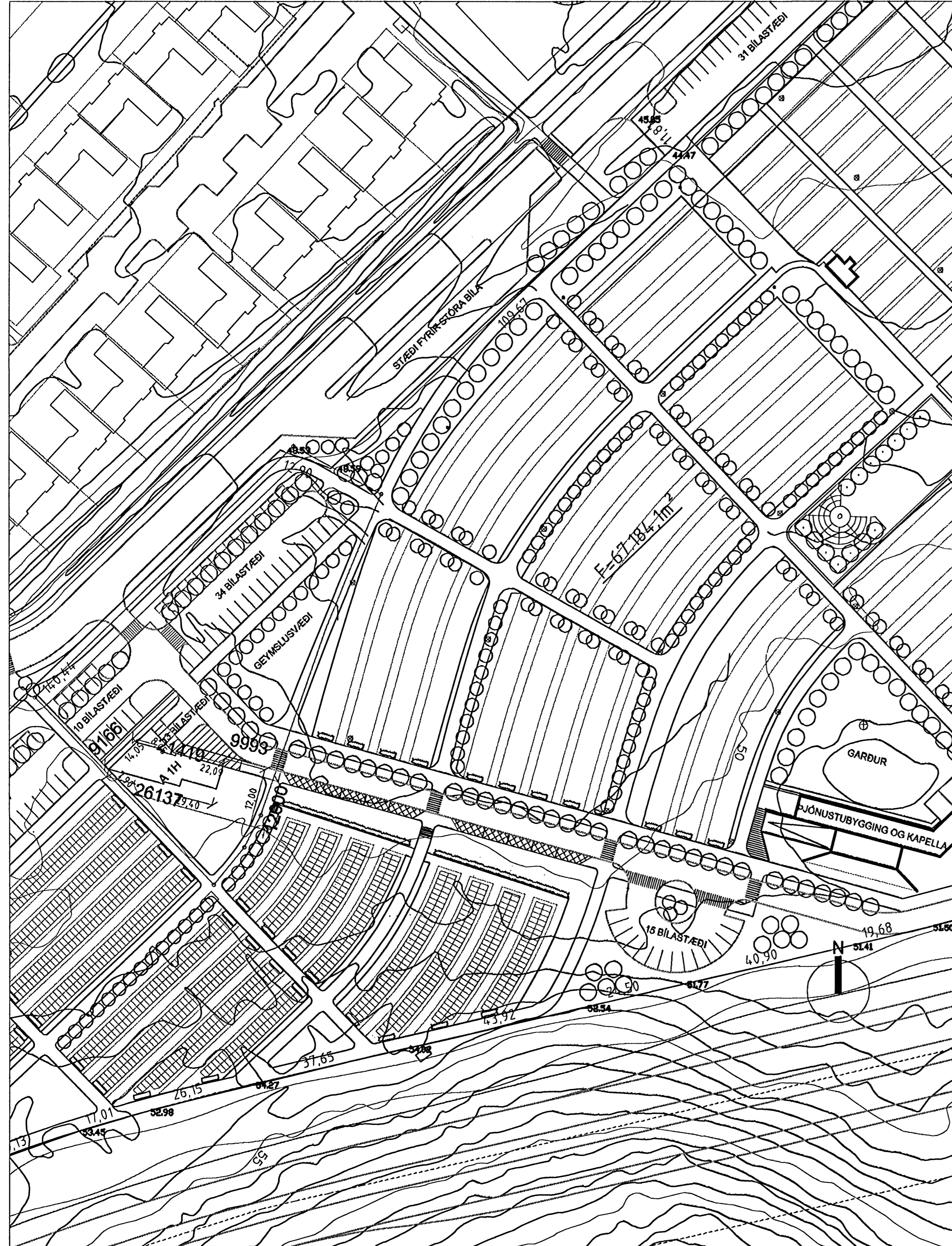
afstöðumynd í mkv. 1:1000