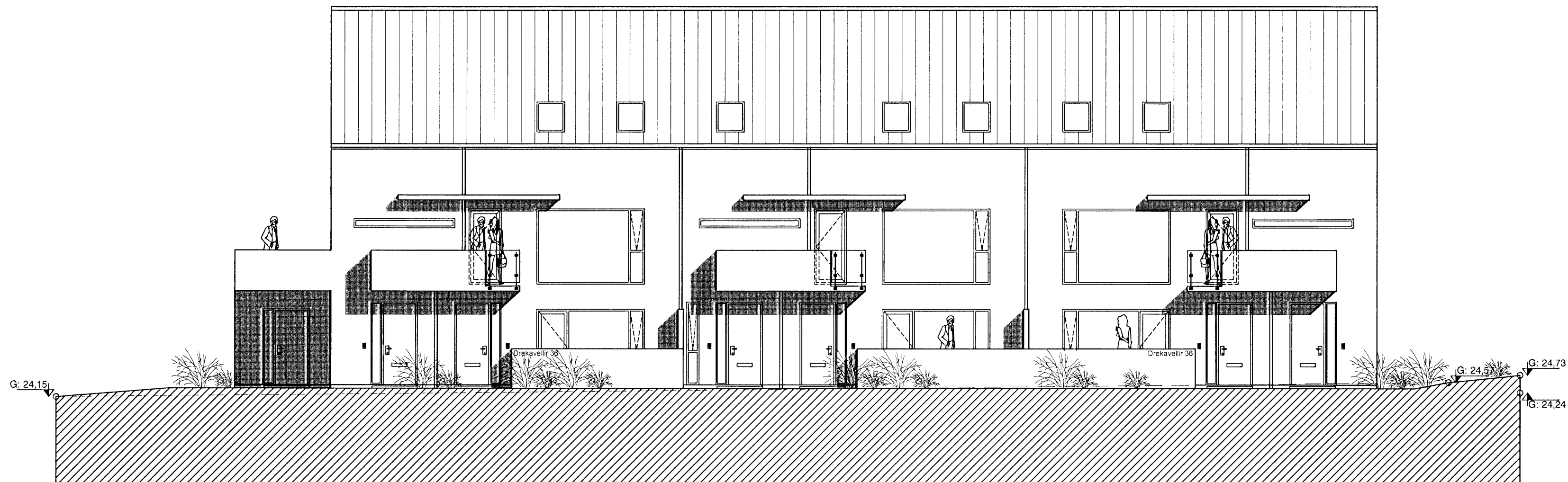
ÚTLIT TIL SUÐURS

Sambýkt þann 08/OCT/2008 Byggingarfræðingur / Hafnarfirði Efn. Jón Sigurðsson