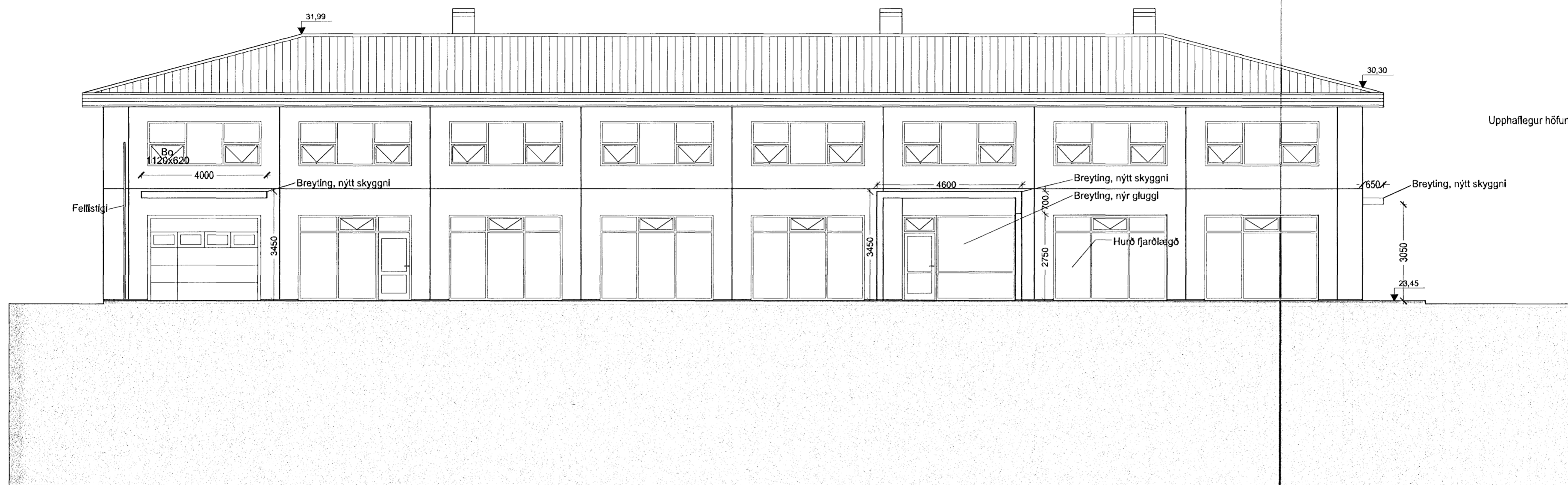
ÚTLIT SUÐUR MKV 1:100