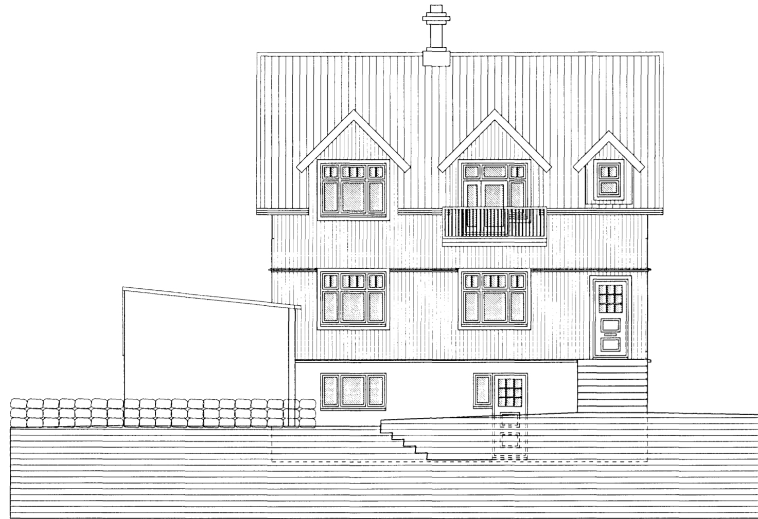
ÚTLIT AUSTUR MKV. 1:100.