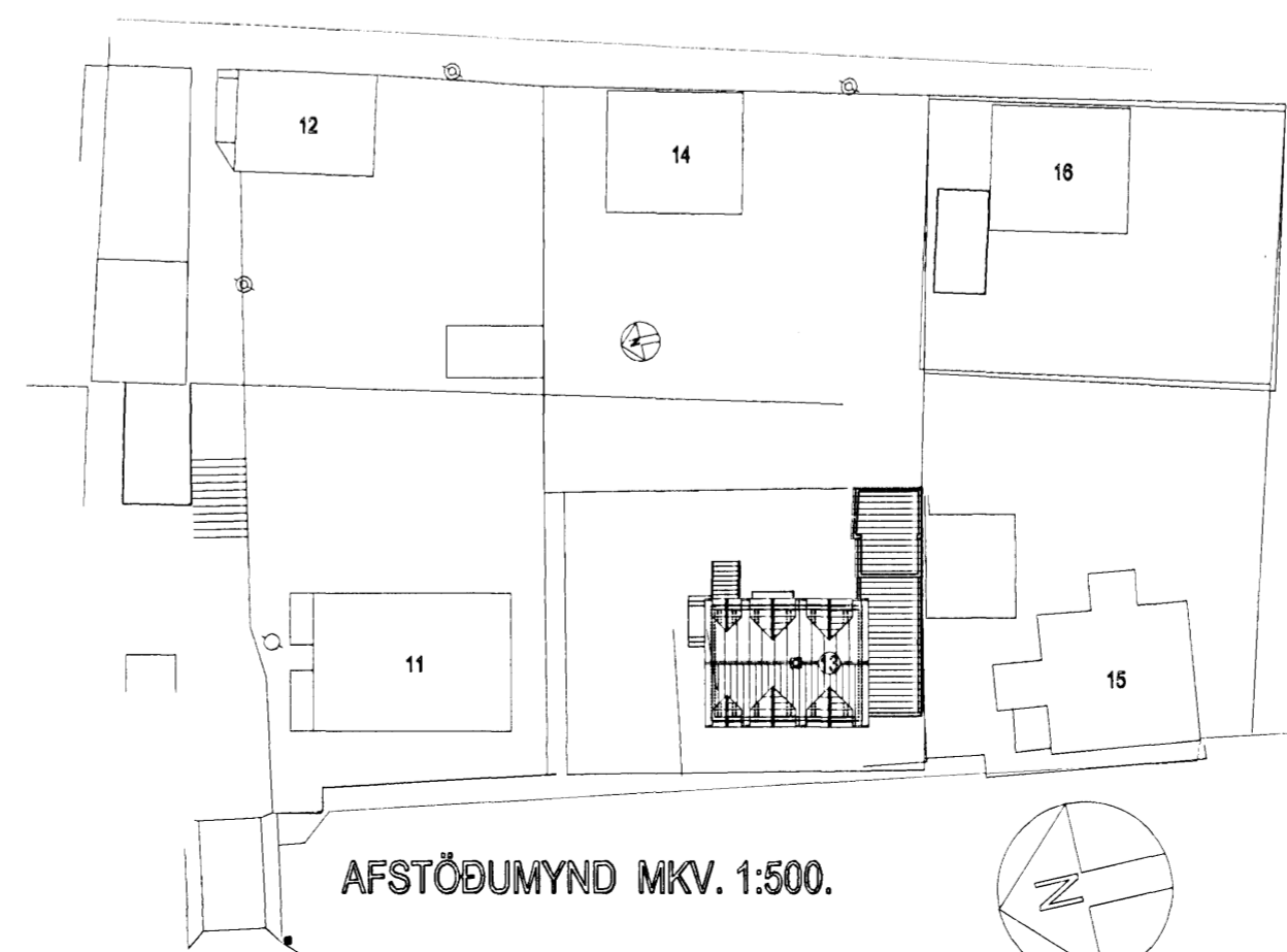
AFSTÖÐUMYND MKV. 1:500.