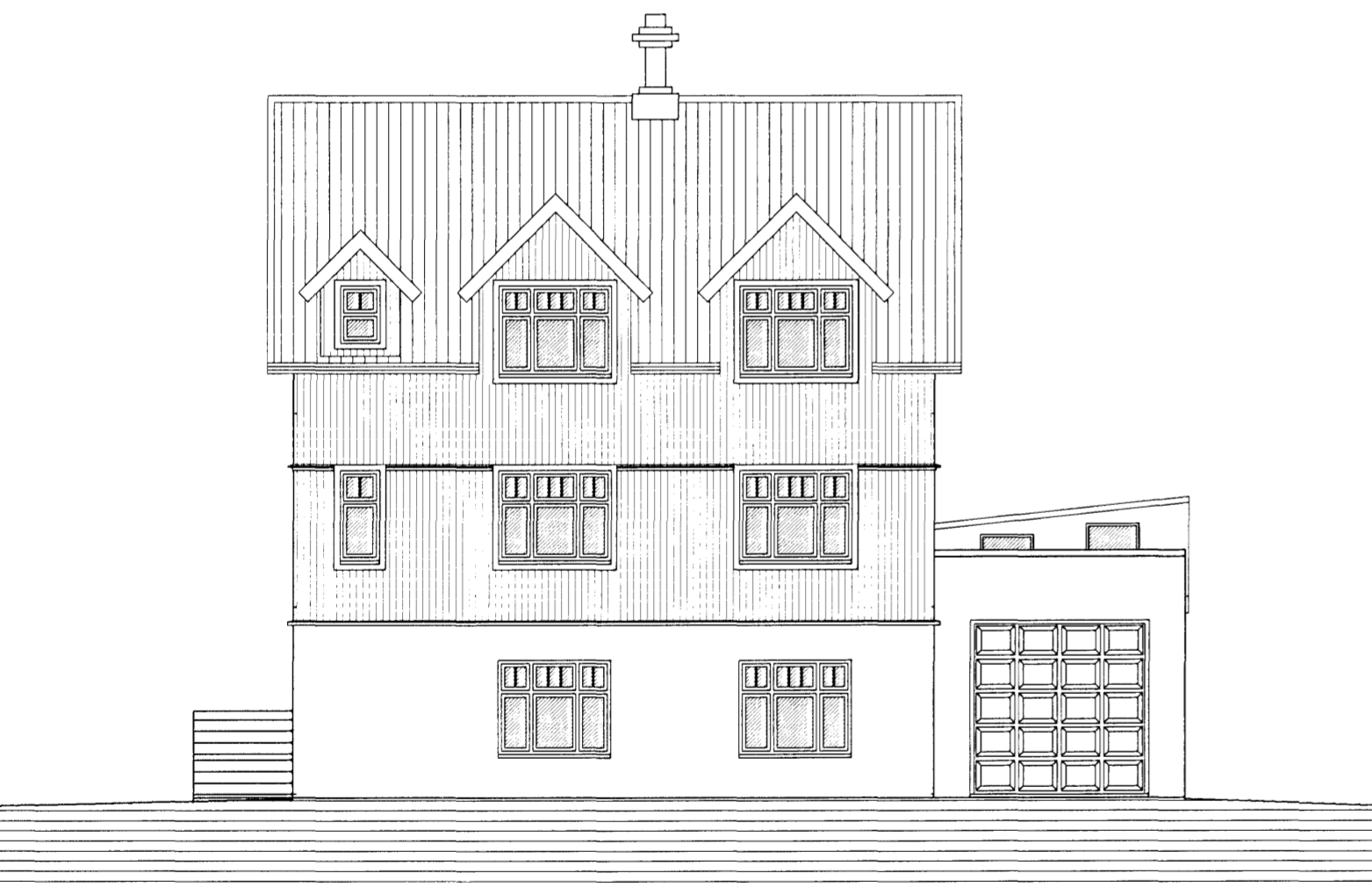
ÚTLIT VESTUR MKV. 1:100.