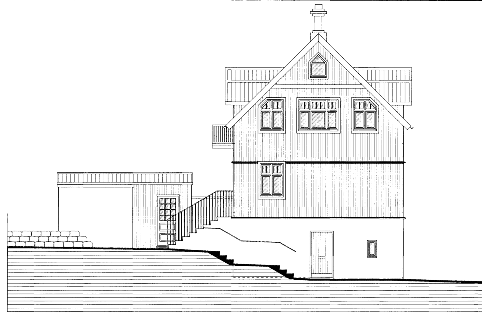
ÚTLIT NORÐUR MKV. 1:100.