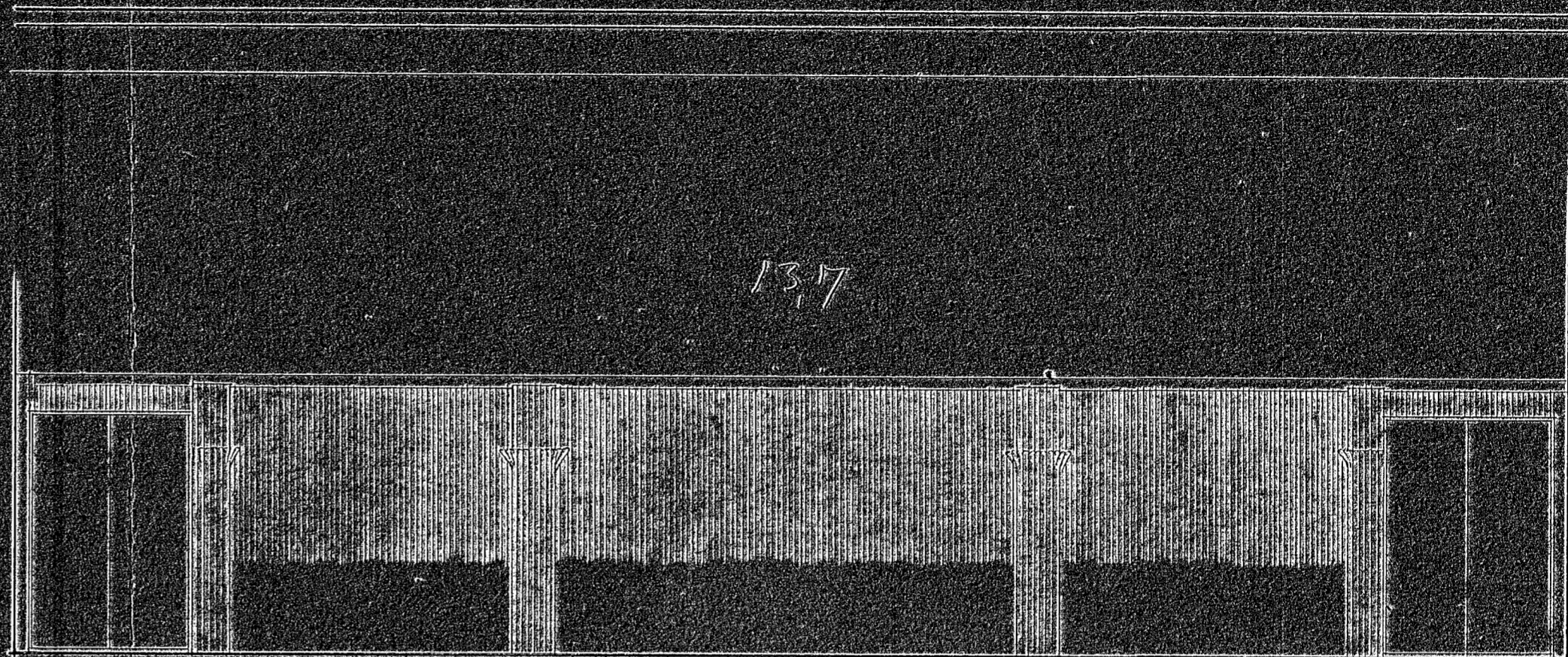
Búðveggur, stöð og gólf.

Teikning mynd Regisjandi, mynd 42 Sigr. Halldórsson.