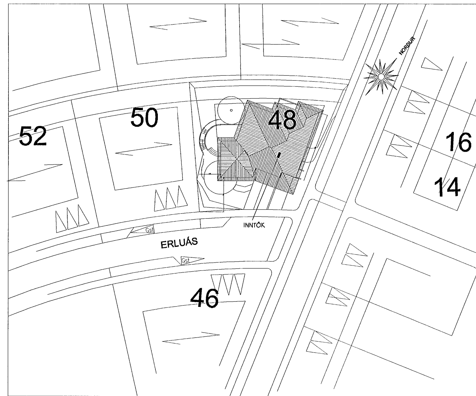
AFSTÖÐUMYND MKV. 1:500.