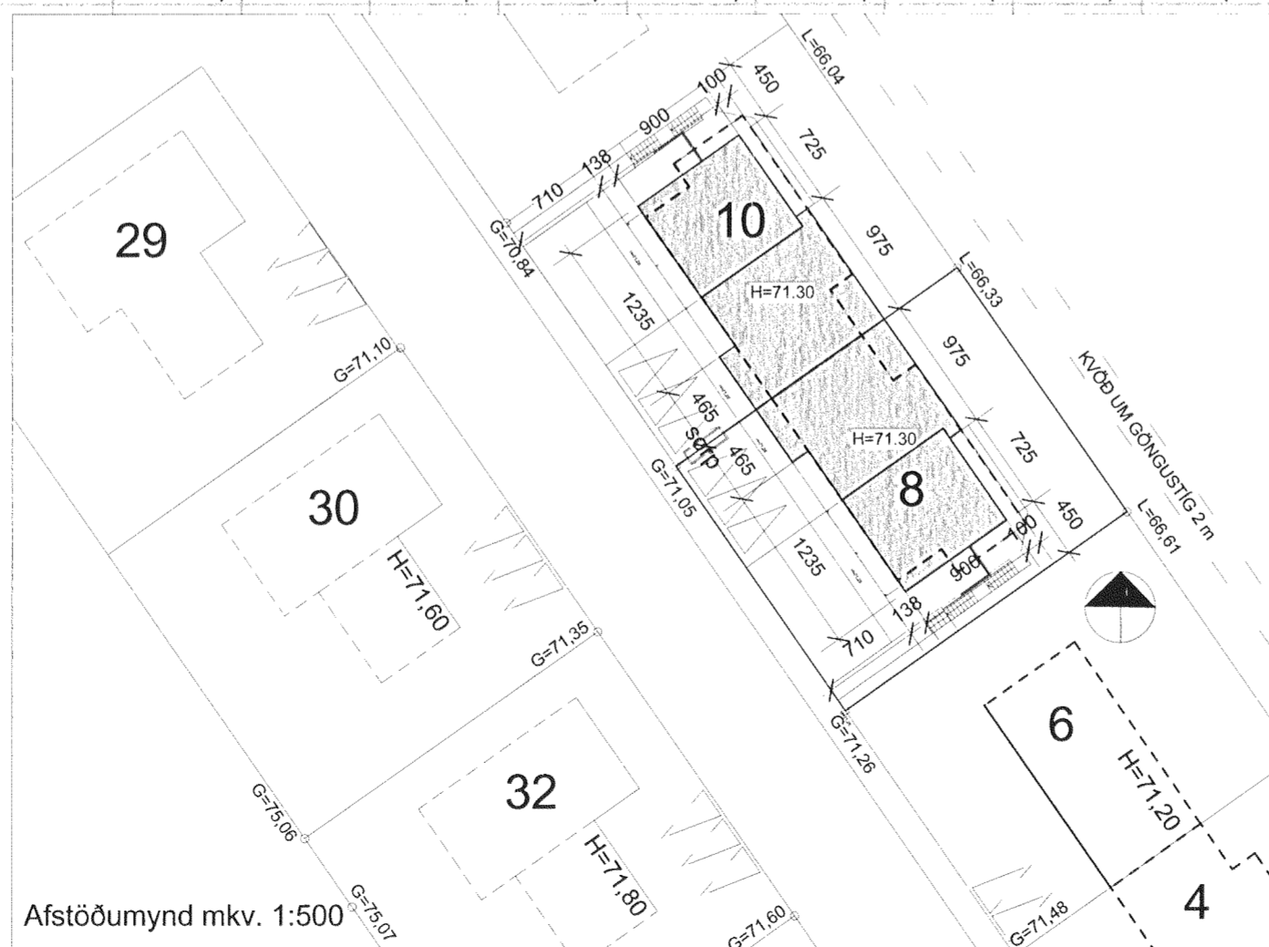
Afstöðumynd mkv. 1:500

Gólfniðurföll eru í öllum votrymum, staðsett á teikningum í mkv. 1:50.