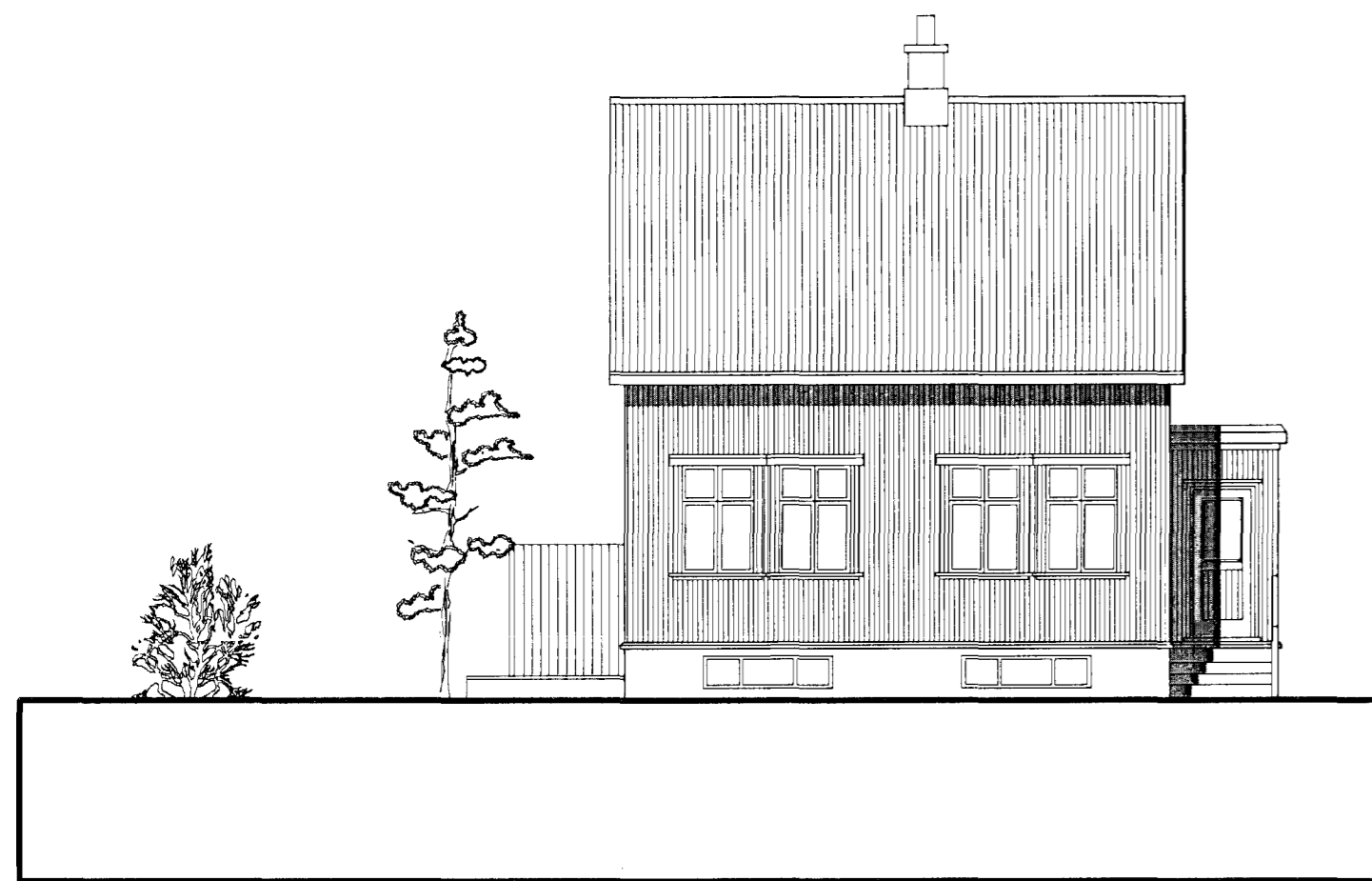
ÁSÝND SUÐ-VESTUR - EFTIR BREYTINGAR mkv. 1:100

Samþykkt þann 14 MARS 2013 Byggingafulltrúinn í Hafnarfirði F.h. Brynjar Rafn Ólafsson