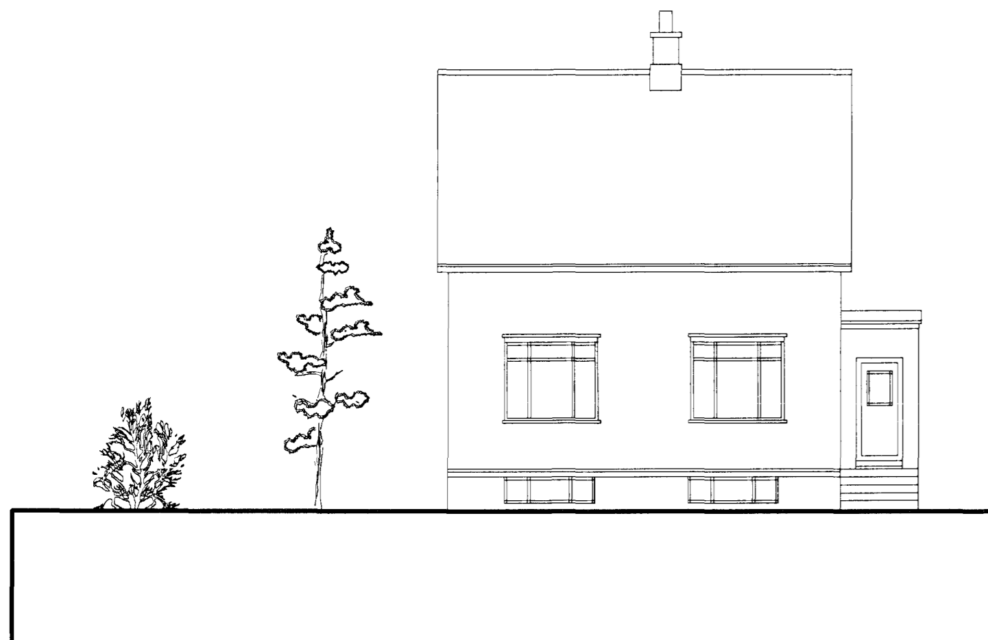
ÁSÝND SUÐ-VESTUR - FYRIR BREYTINGAR mkv. 1:100