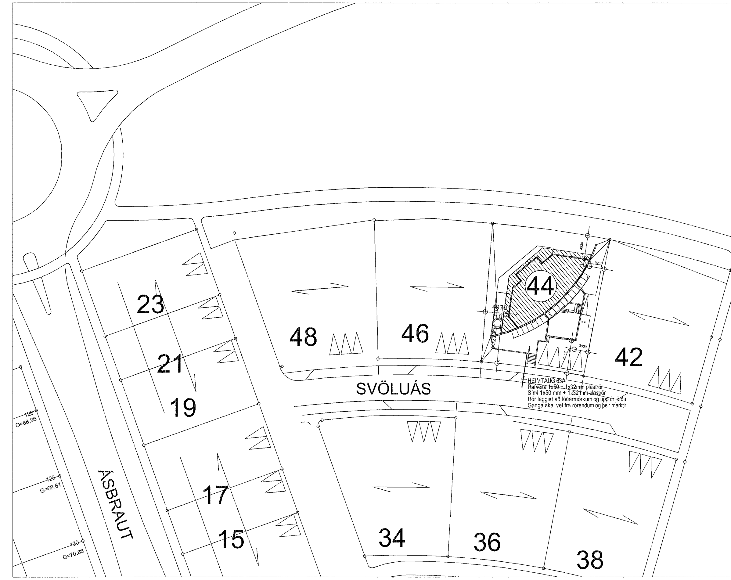
Afstöðumynd, mkv. 1:500