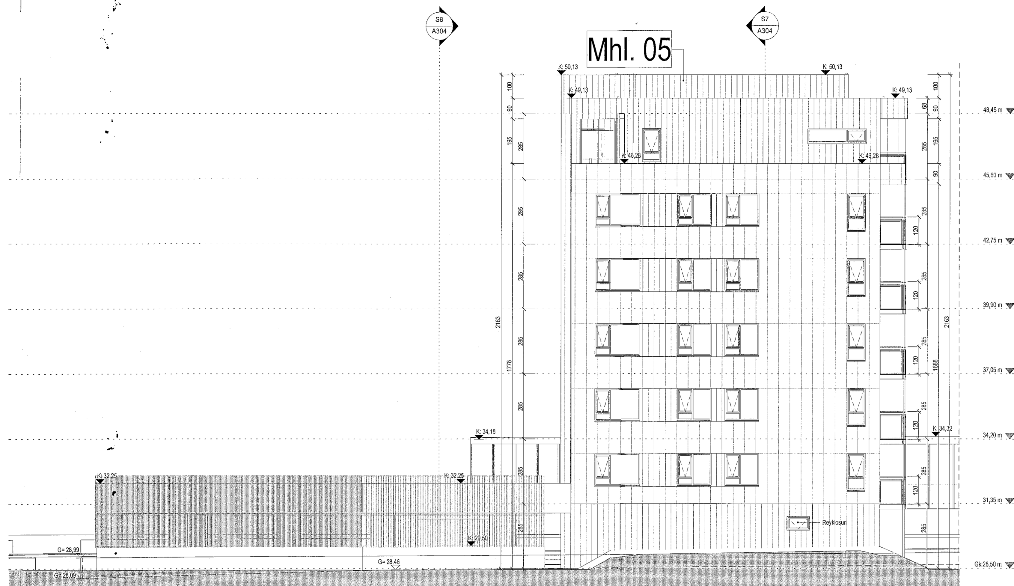
Norður útlit 1:100