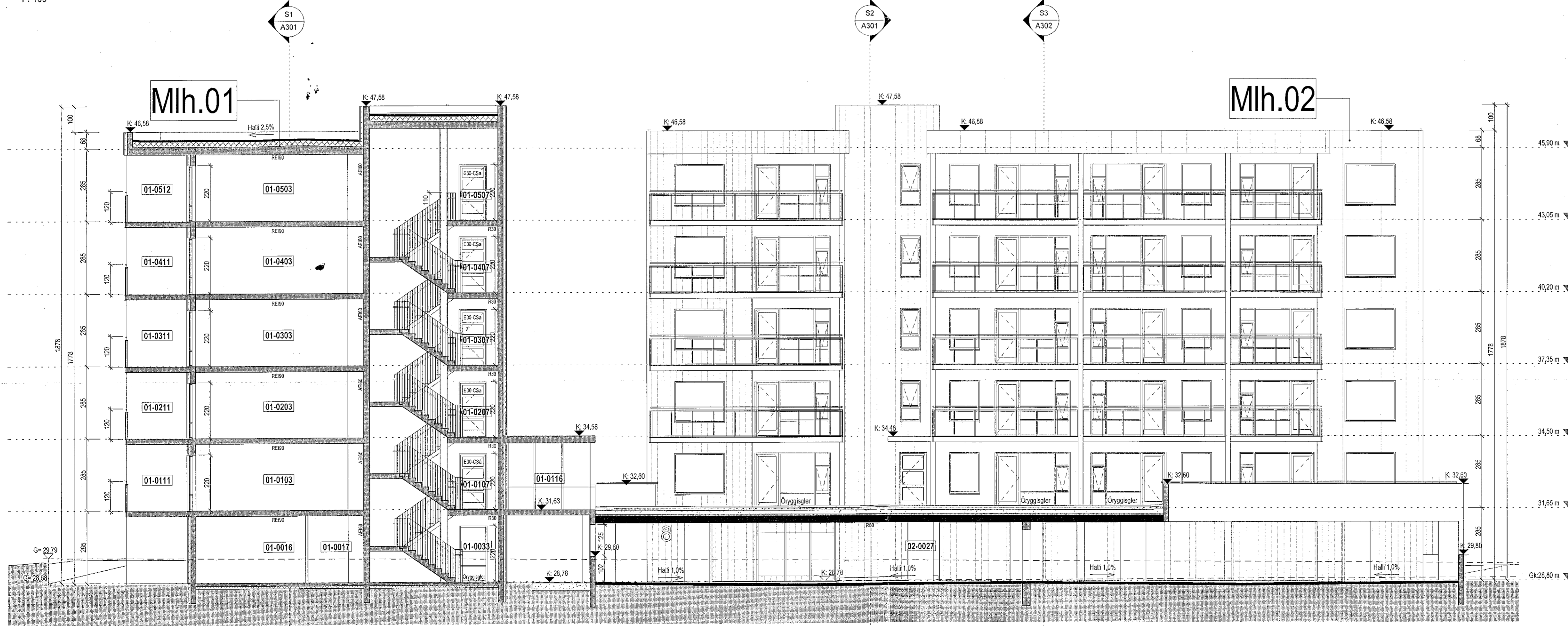
Snið 10a 1:100

Samþykkt þann 04. MAÍ 2022 Byggingarlögmenn í Hafnarfirði Skelton Björnsson