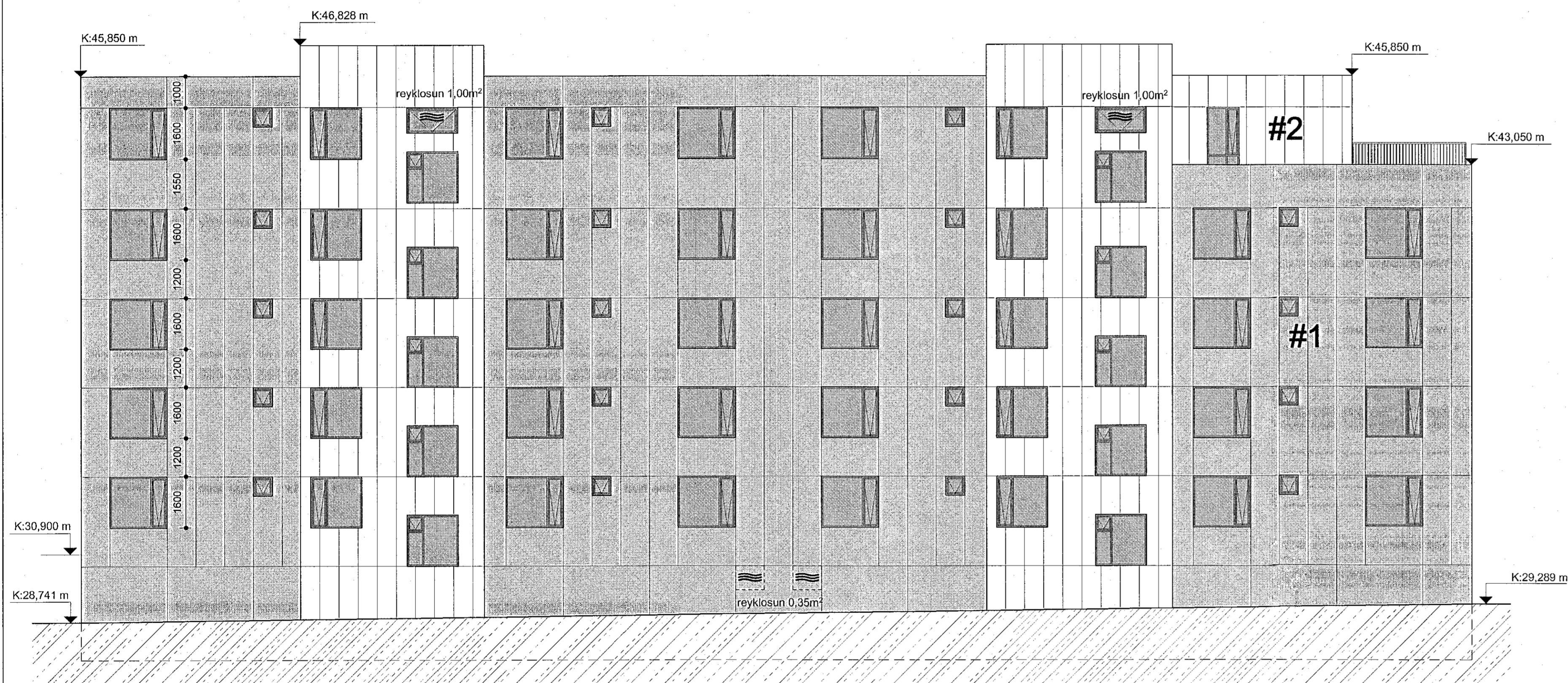
Áshamar 12-14 mhl.01 - ásýnd norður mkv: 1 : 100