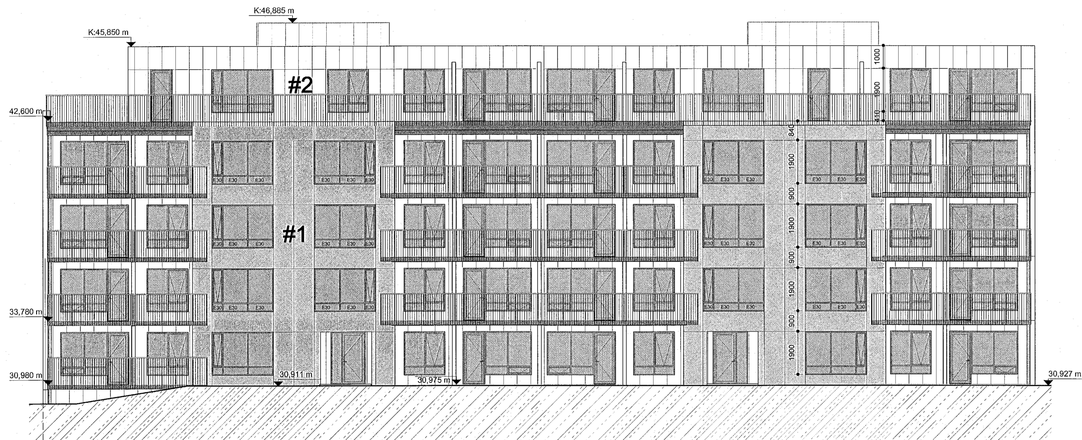
Áshamar 16-18 mhl.02 - ásýnd suður mkv: 1 : 100