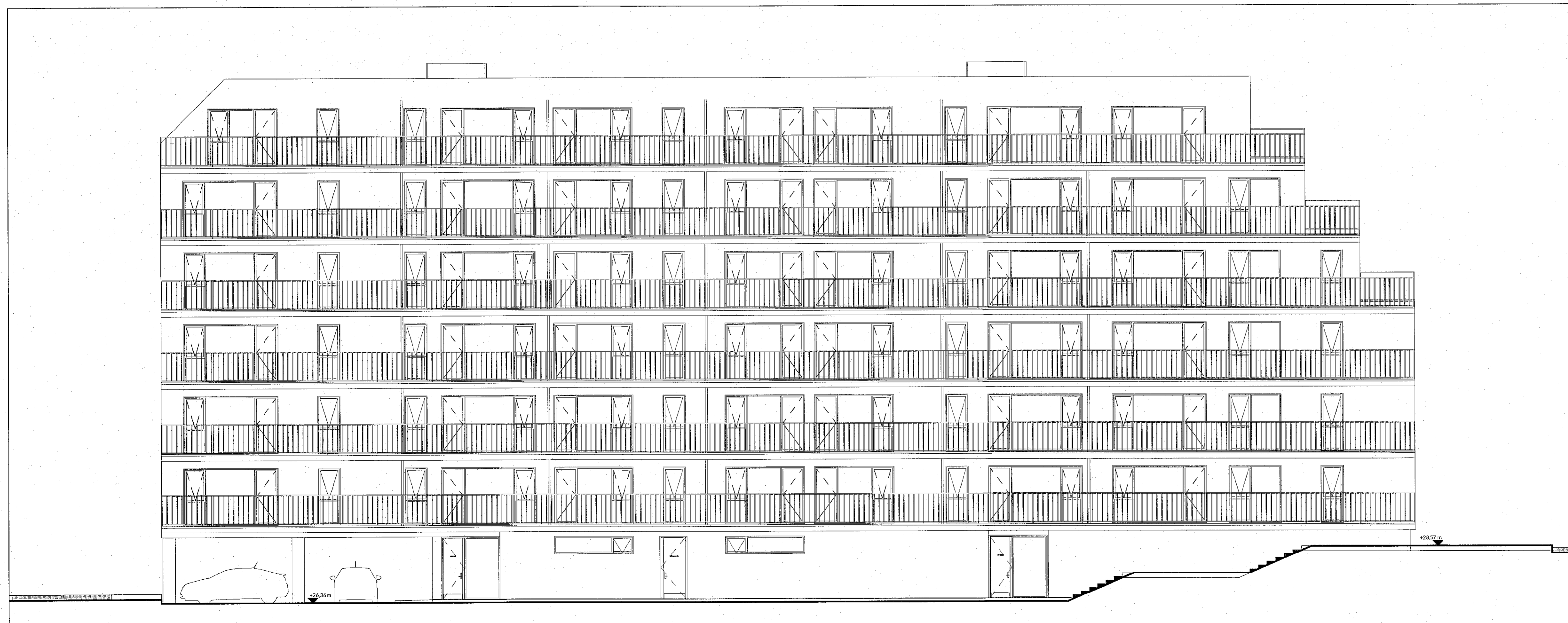
Útlit Vestur Mhl.02 1:100