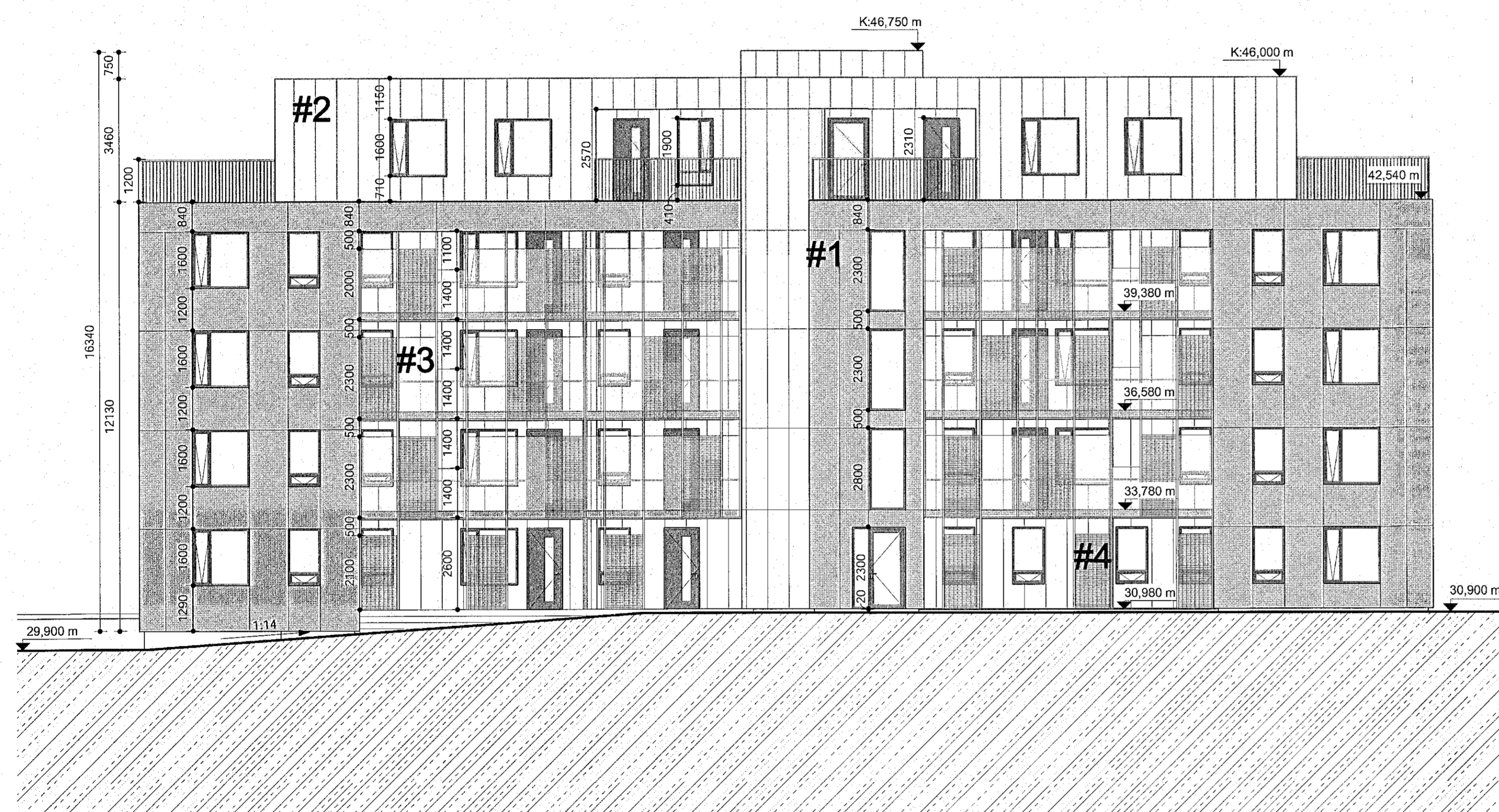
Ásamar 26 mhl.06 - ásýnd austur mkv: 1 : 100