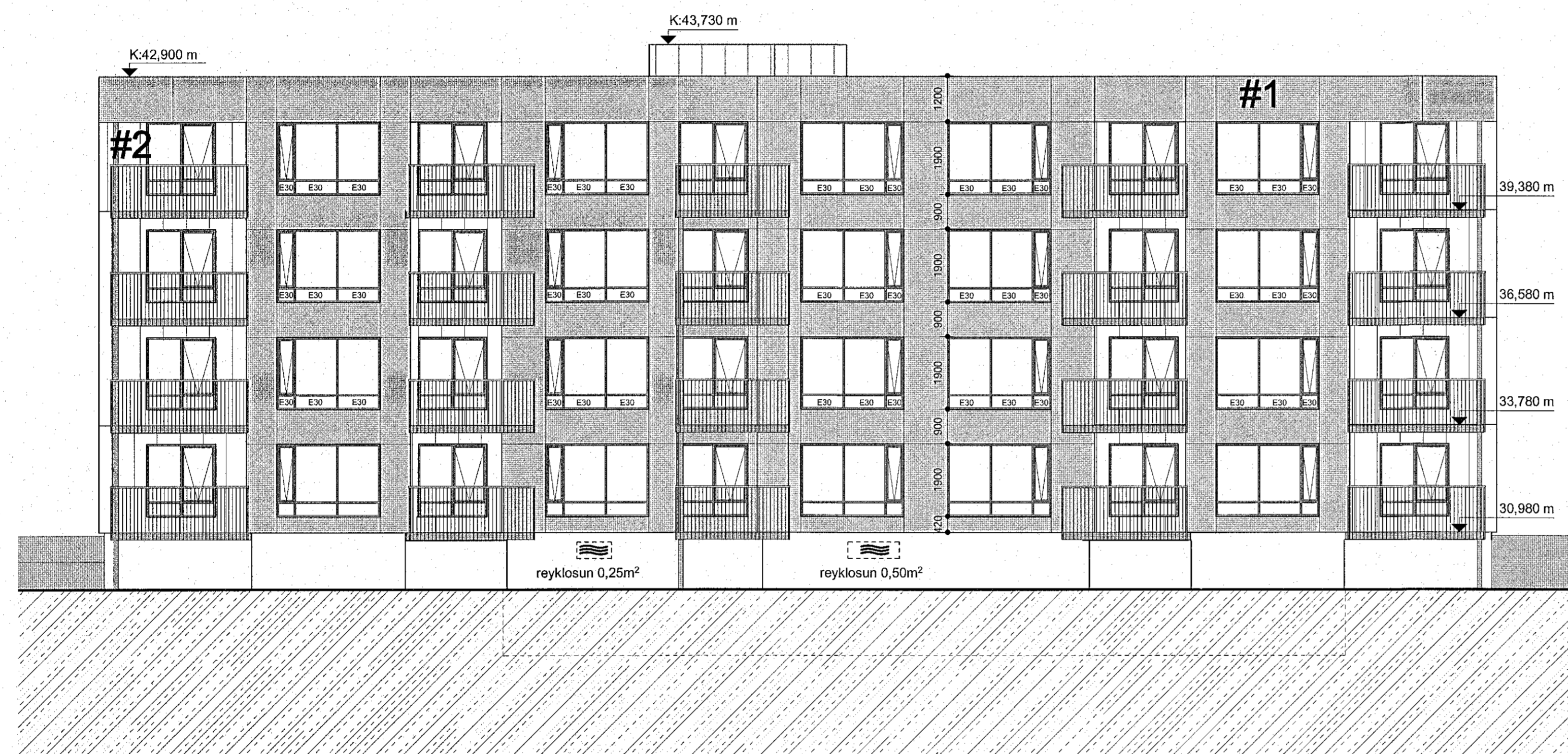
Áshamar 22 mhl.04 - ásýnd vestur