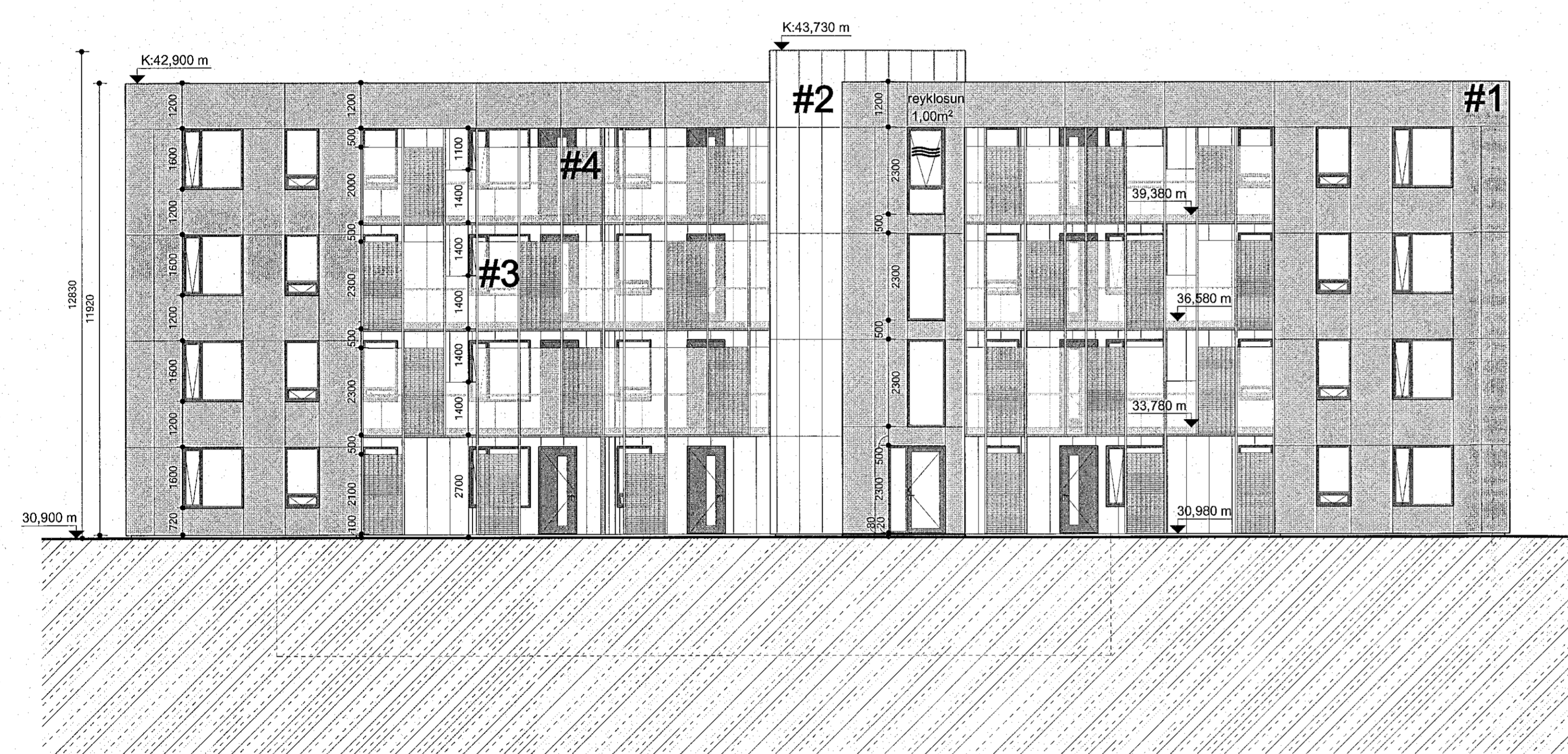
Áshamar 22 mhl.04 - ásýnd austur mkv: 1 : 100