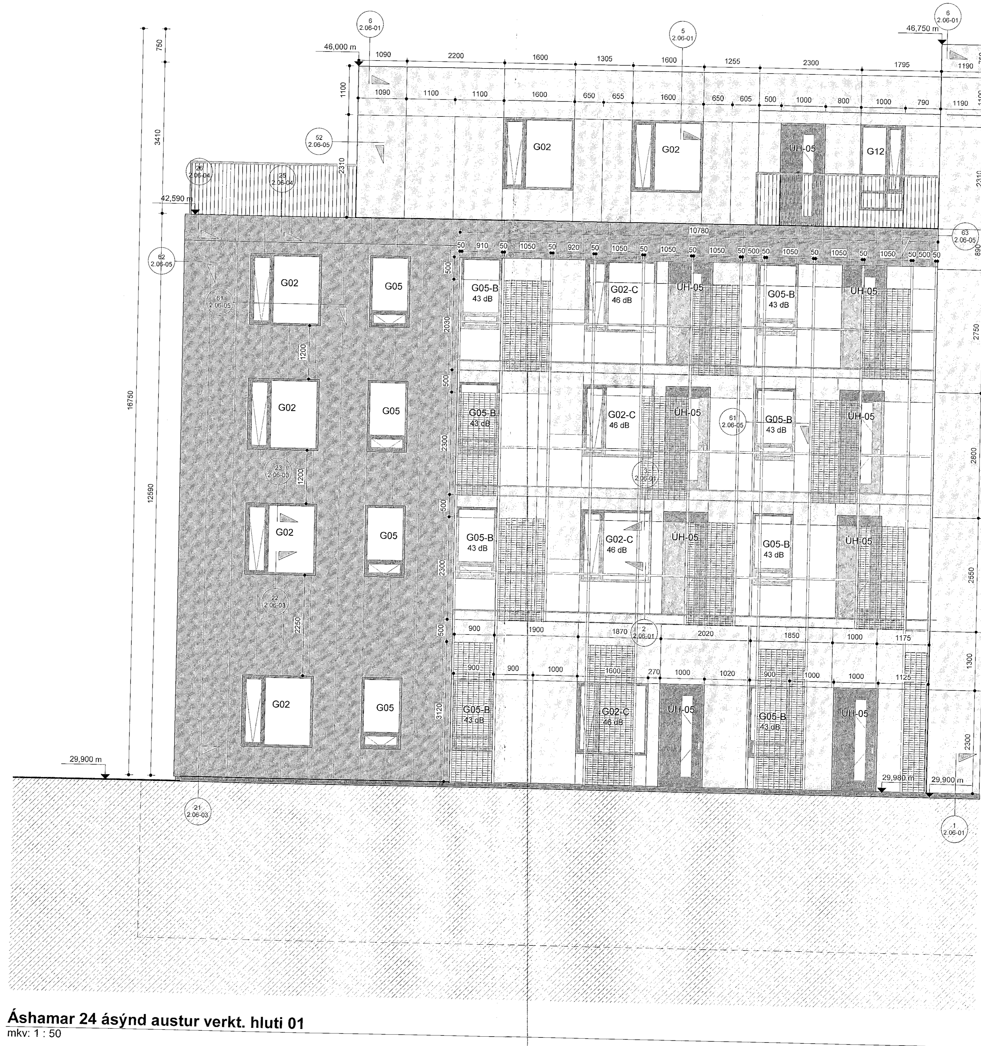
Áshamar 24 ásýnd austur verkt. hluti 01 mkv: 1 : 50

Sampykkt bann 01. ágú. 2023 Fh. Byggingarfulltrúans í Hafnarfirði Róbert A. Róbertsson