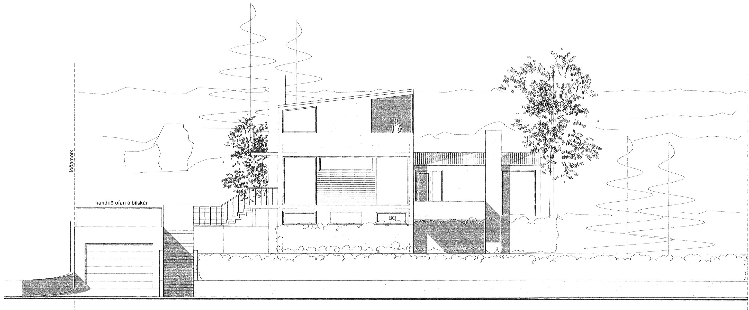
ÚTLIT NORÐVESTUR M 1 : 100