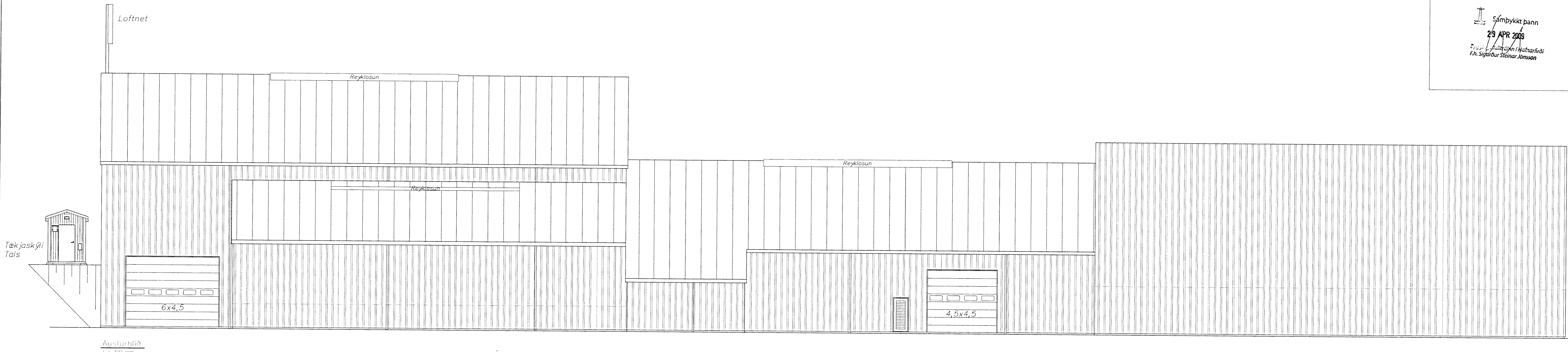
Austurbíð 1:100 mm

Sámbýkkt þann 29 APR 2009 Eign: Umhæðslu- og Úrvinnsluhús F.h. Sigurður Steinar Jónsson