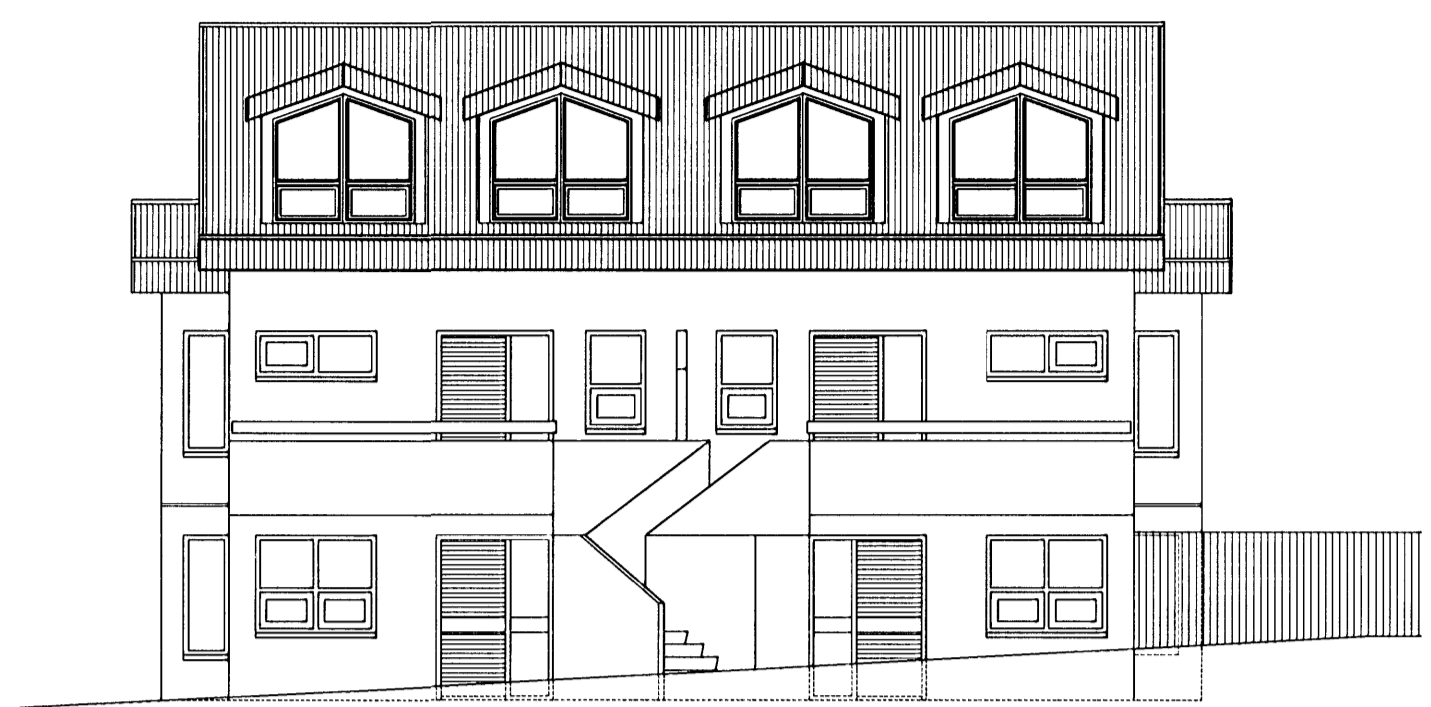
Útlit austur 1:100