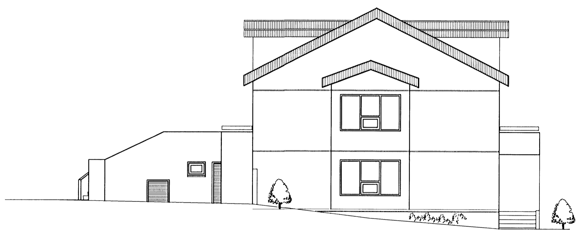
Útlit norður 1:100

Skýringar vegna eldvarna: ---> B.O. táknað björgunarop, samkv. reglugerð um brunavarnir og brunamál —> Táknað rýmingarleið, samkv. reglugerð um brunavarnir og brunamál. ⊗ Reykskynjari, staðsetjast samkv. teikningu.