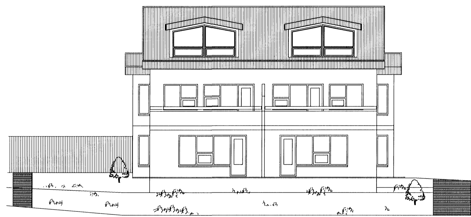
Útlit vestur 1:100