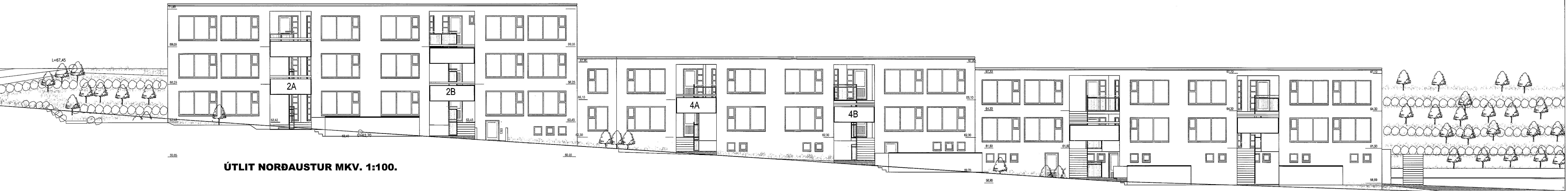
ÚTLIT NORÐAUSTUR MKV. 1:100.