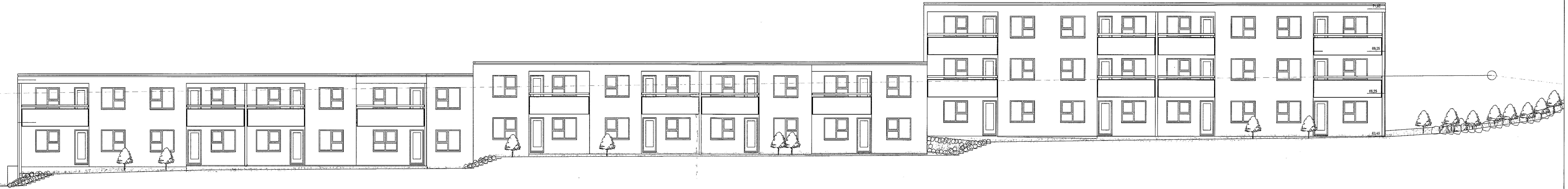
ÚTLIT SUÐVESTUR MKV. 1:100.