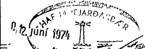
SNID - E 1:20