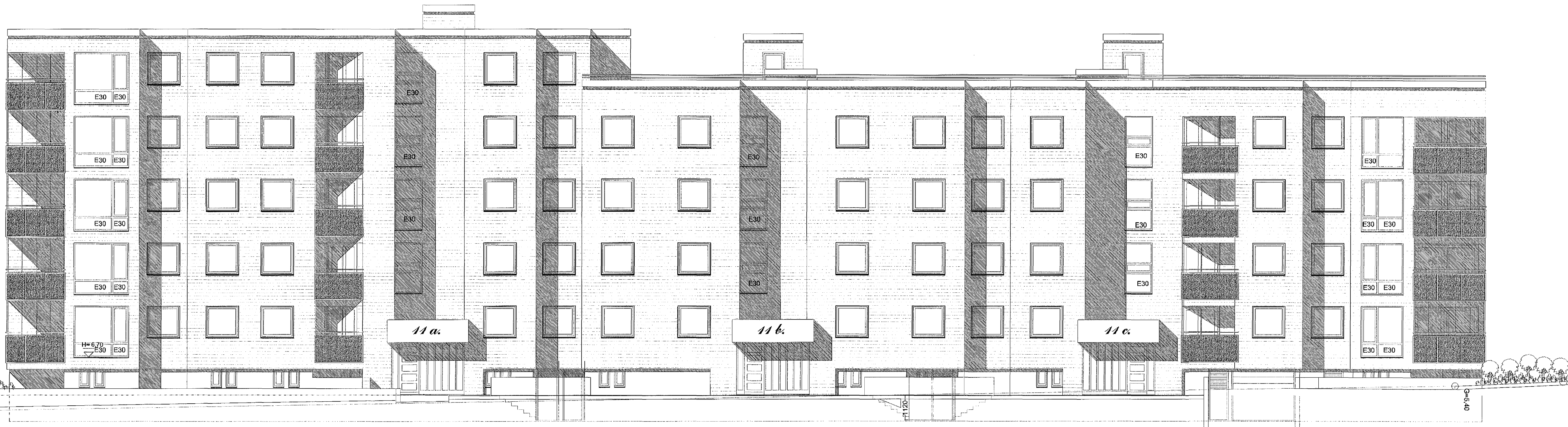
AUSTUR. MKV. 1:100.

SVALASKÝLL Svalaskýllur er lokað með 8-10 mm hertu gleri. Hverju svalaskýli er lokað (B-LOKUN) með gjerséningum sem hvíla í þar til gerðum álbrautum. Svalaskýlin eru opnanleg sbr. grein 102 í byggingareglugerð. Niðurföll og yfirföll eru á svölum.