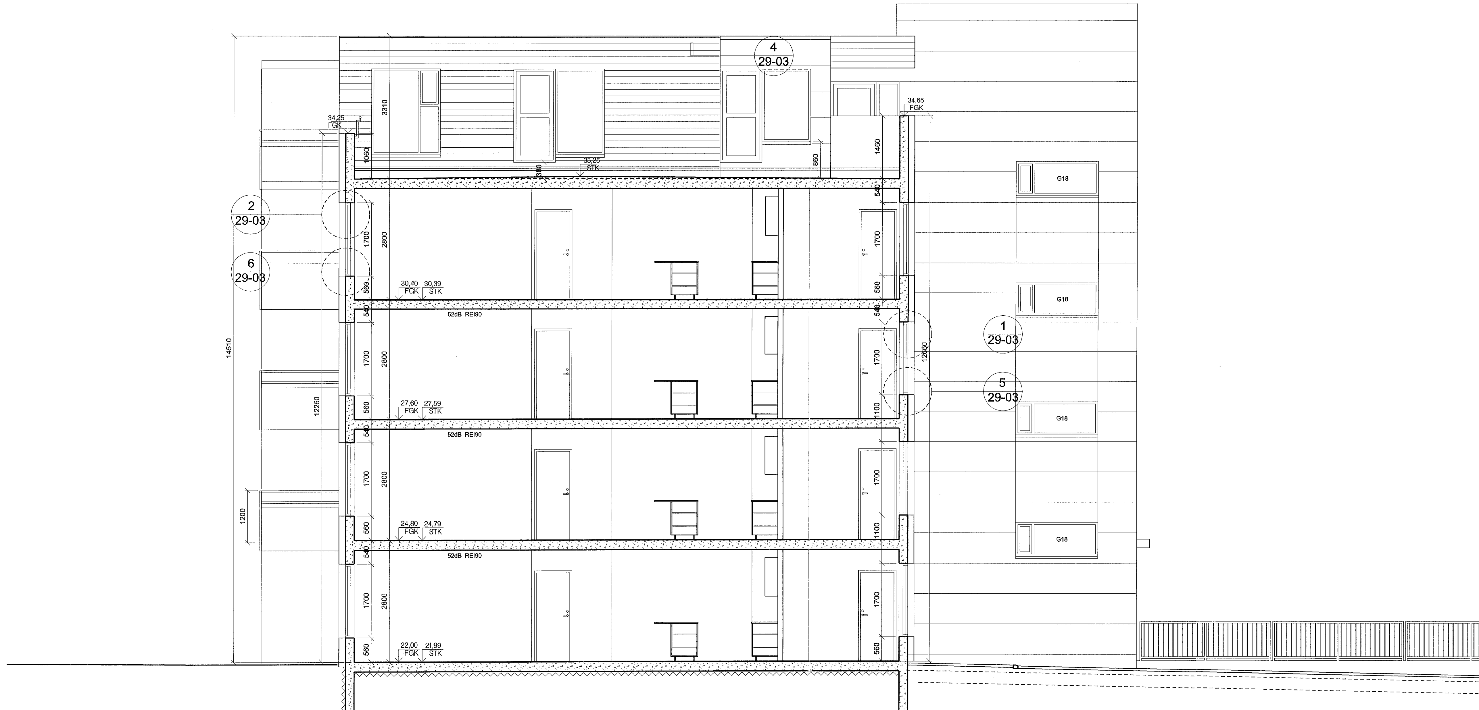
F-F 20-02 20-04 20-06 20-08 20-10 20-12 20-14 SNEIÐING 1:50

ÚTSAGA | TERNAD | VIFIRFARÐ | IDAGS BÍEYTINGAR