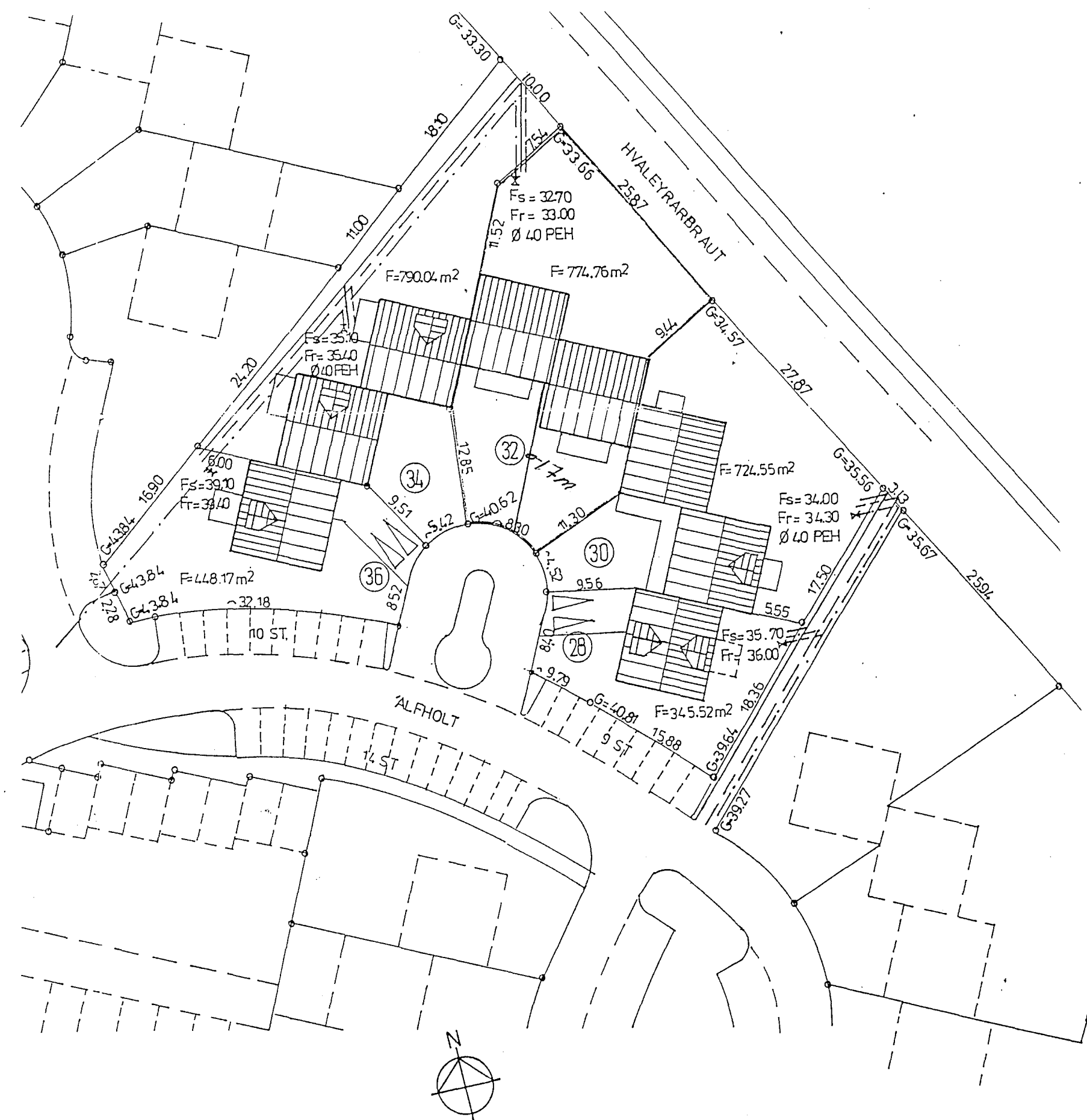
AFSTÖÐUMYND MÆLIKVARDI 1:500

Herpi Höllue settu utan um streng og rör