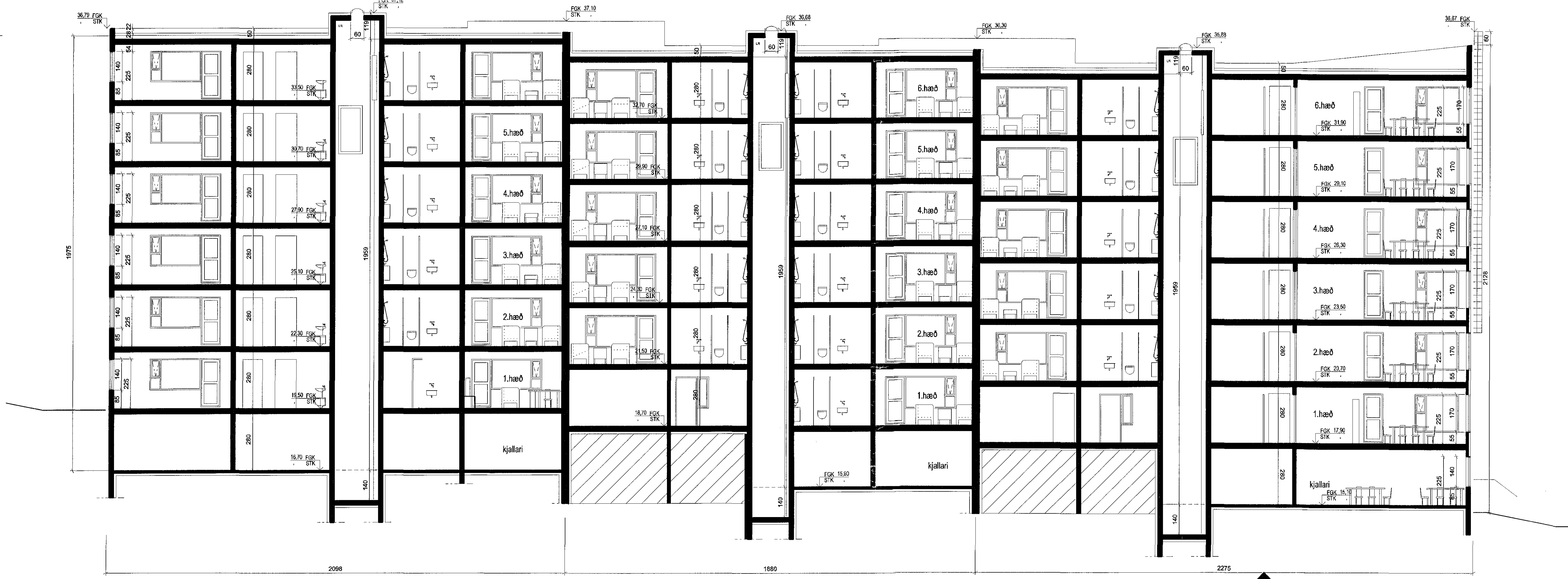
SNEIÐING 1:100 snið B-B