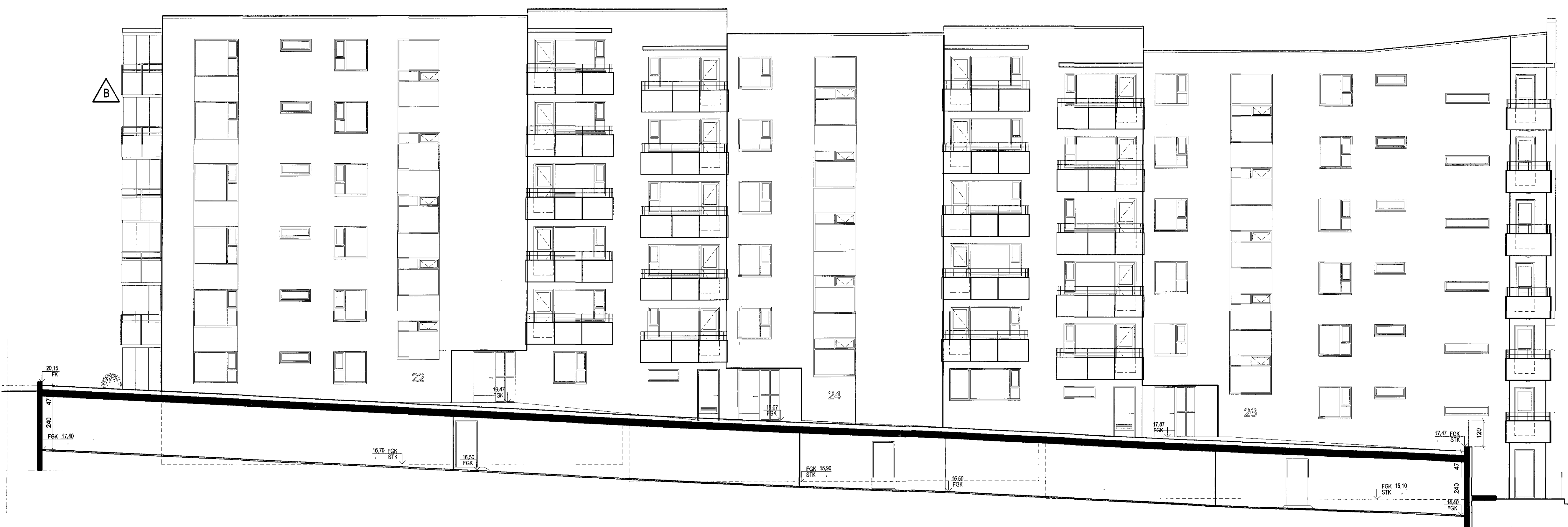
SNEIDING 1:100 snið c-c