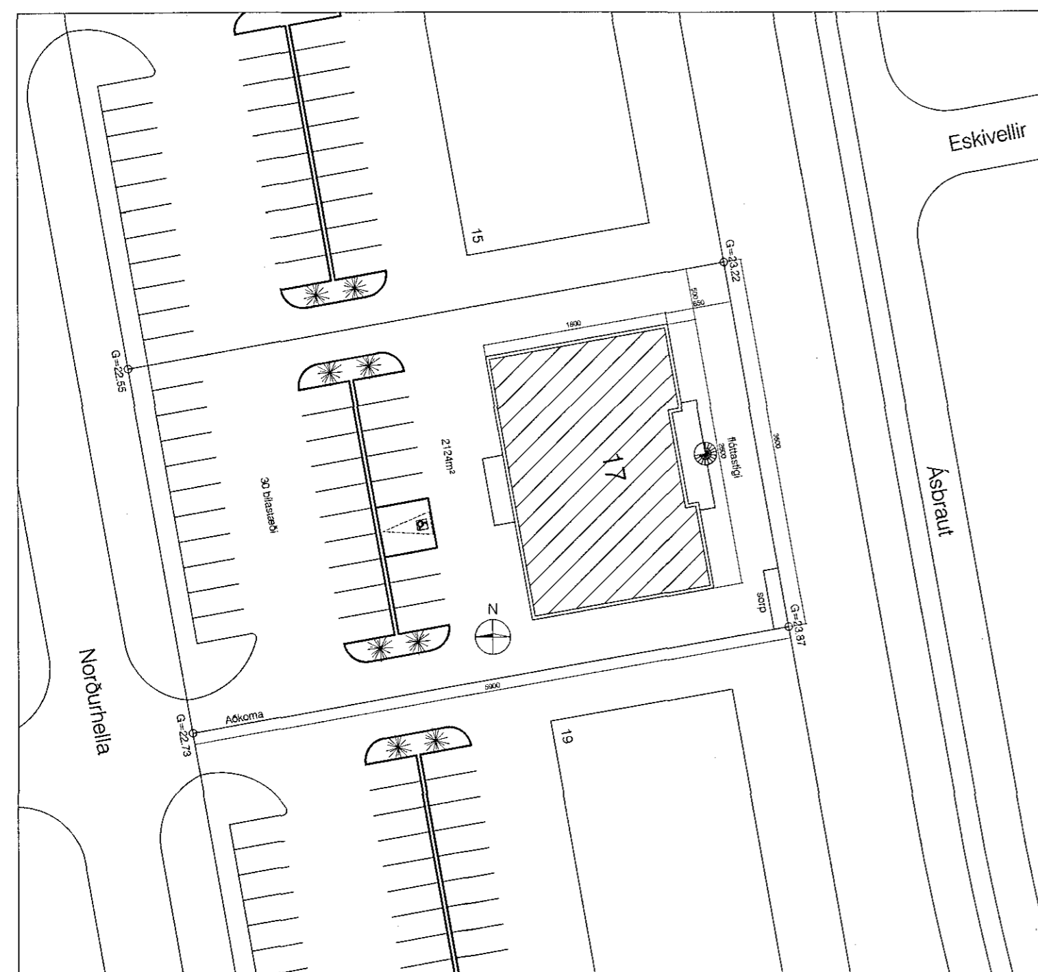
Yfirlitsmynd - 1:500

Norðurhella 17, innrétting gistiheimilis í þegar byggðu húsi.