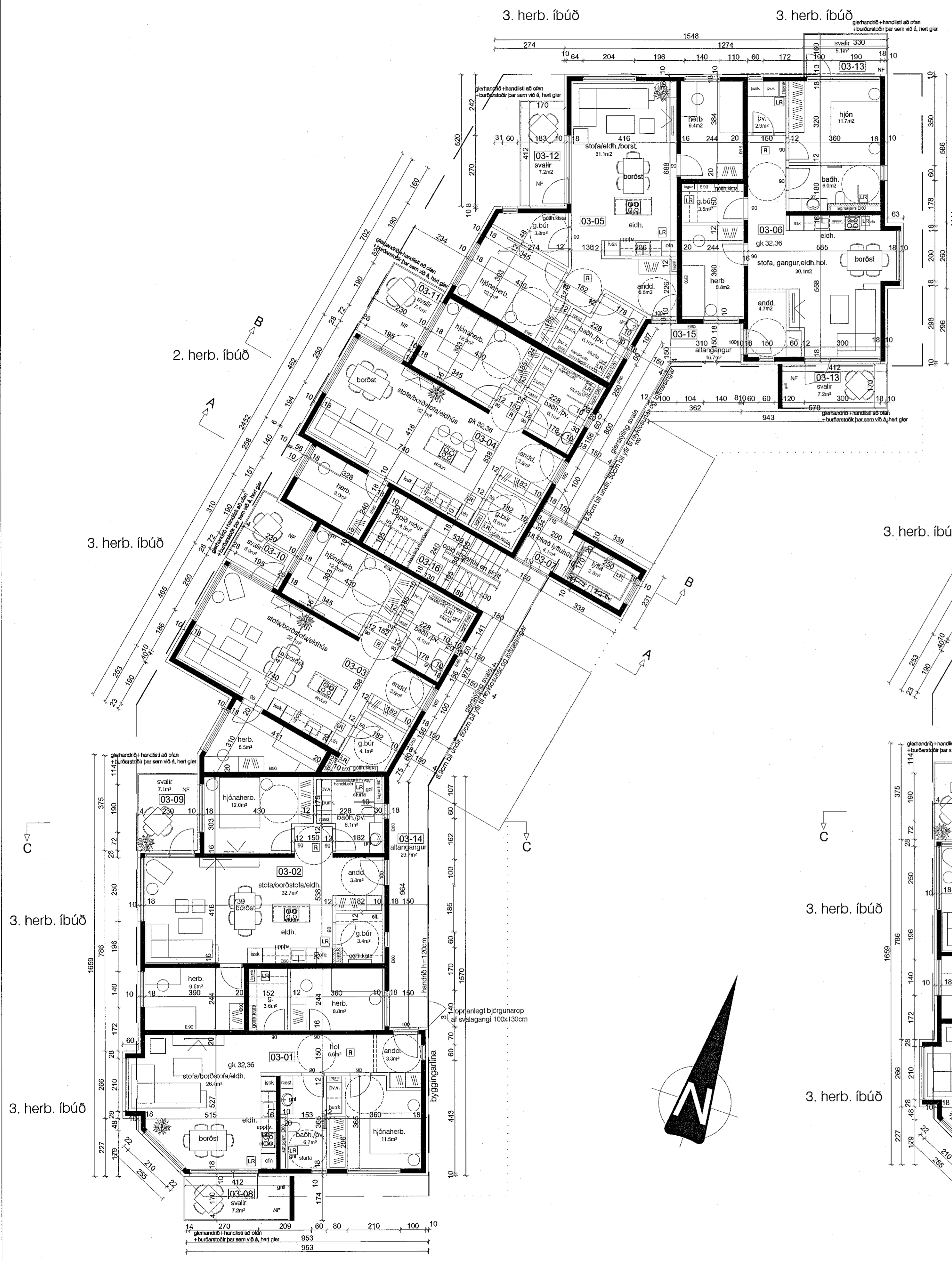
grunnmynd 3. hæð