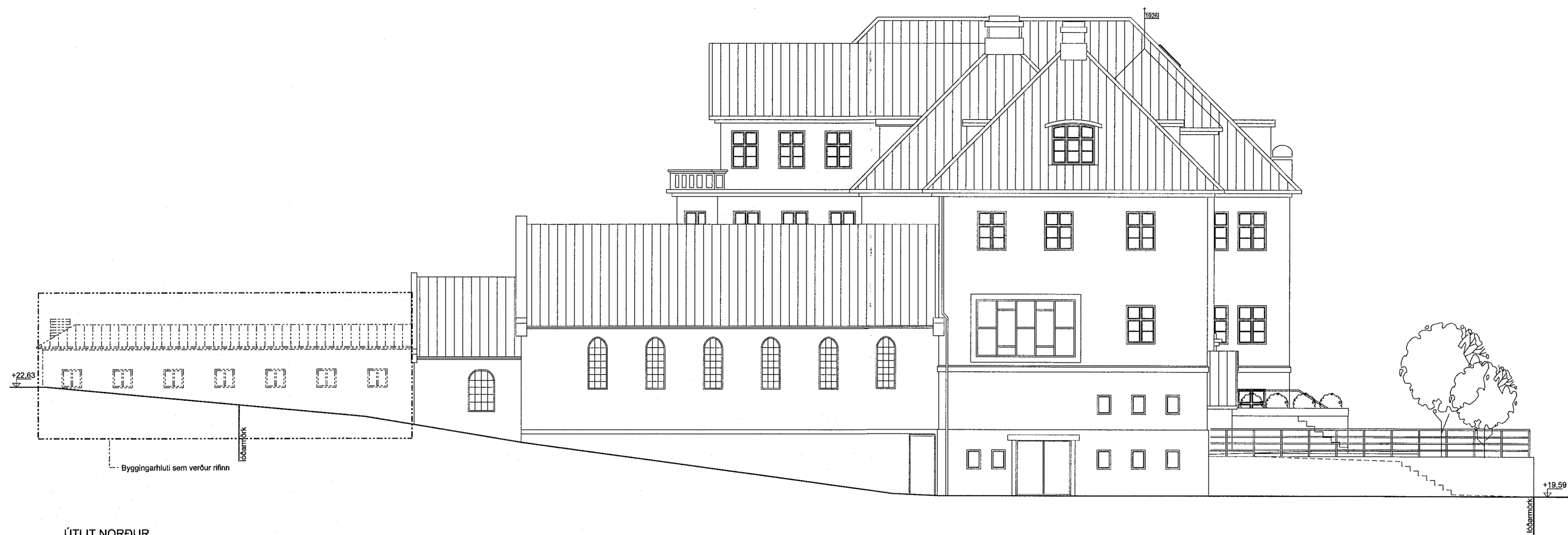
ÚTLIT NORÐUR MKV 1:100