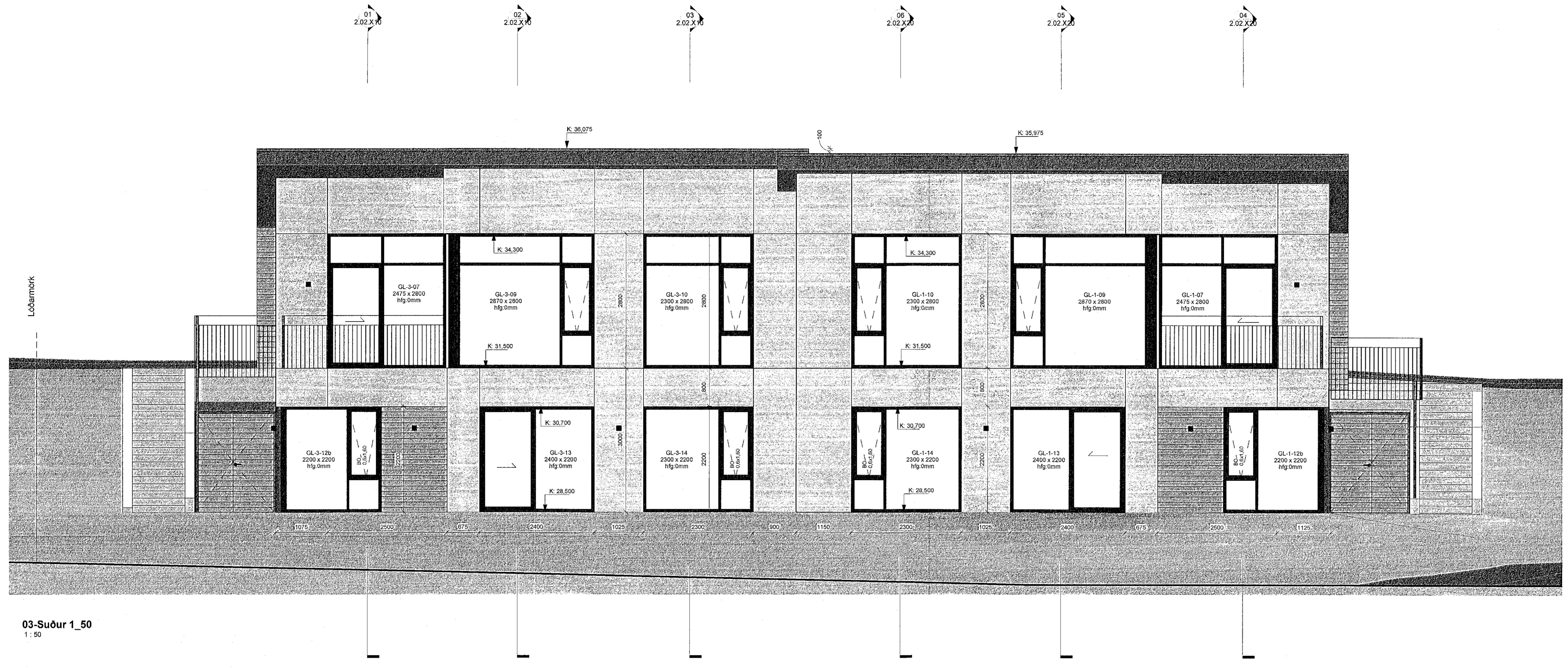
03-Suður 1_50 1:50

Öll mál takist/staðfæris á staðnum áður en smíði hefst. Misræmi í teikningum skal tafarlaust tilkynna hönnuðum. Teikningar arkitekta skal lesa með teikningum meðhönnuða.