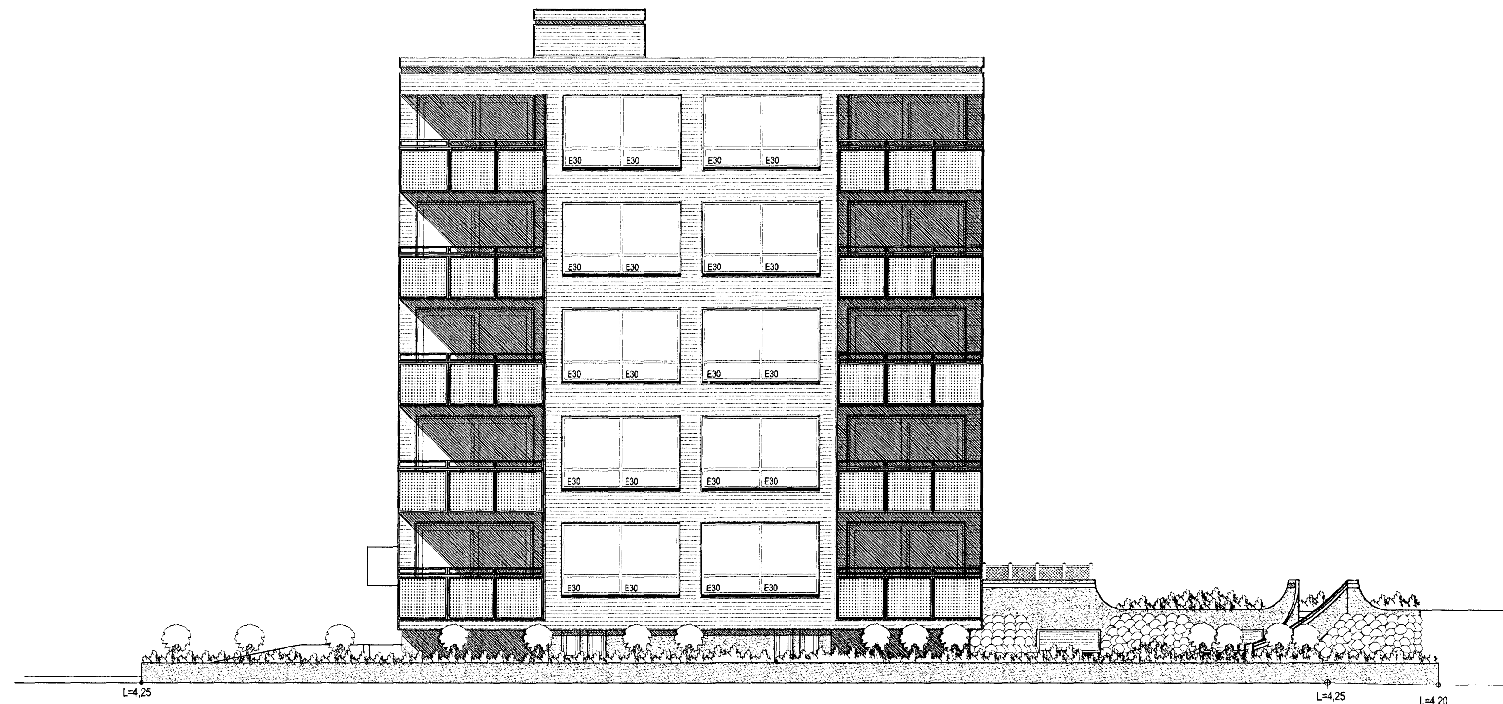
SUÐUR. MKV. 1:100.