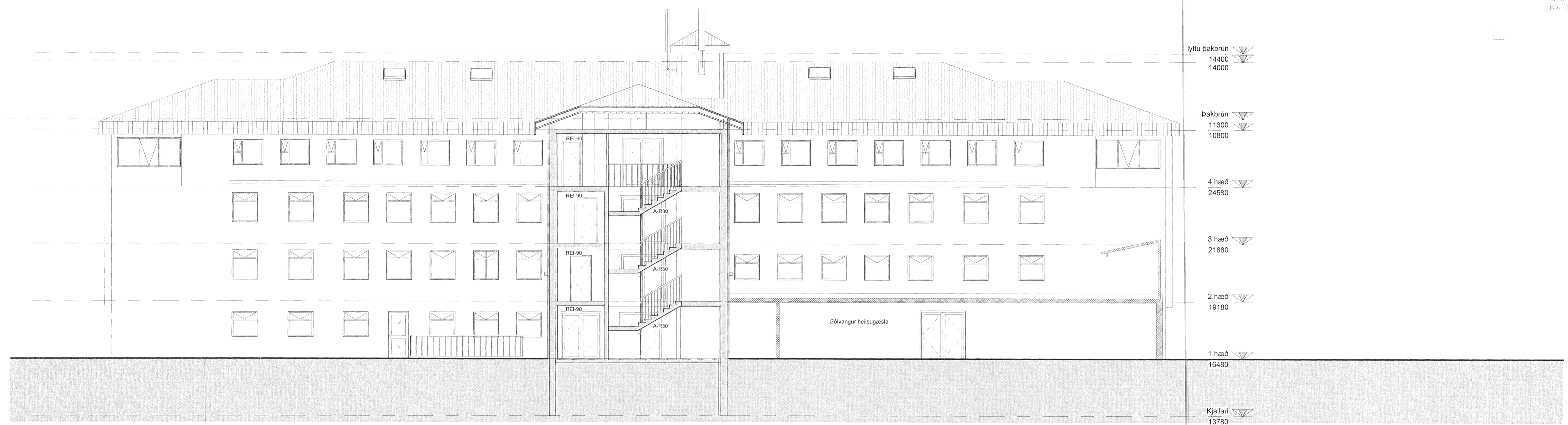
2 Snið 7 1 : 100