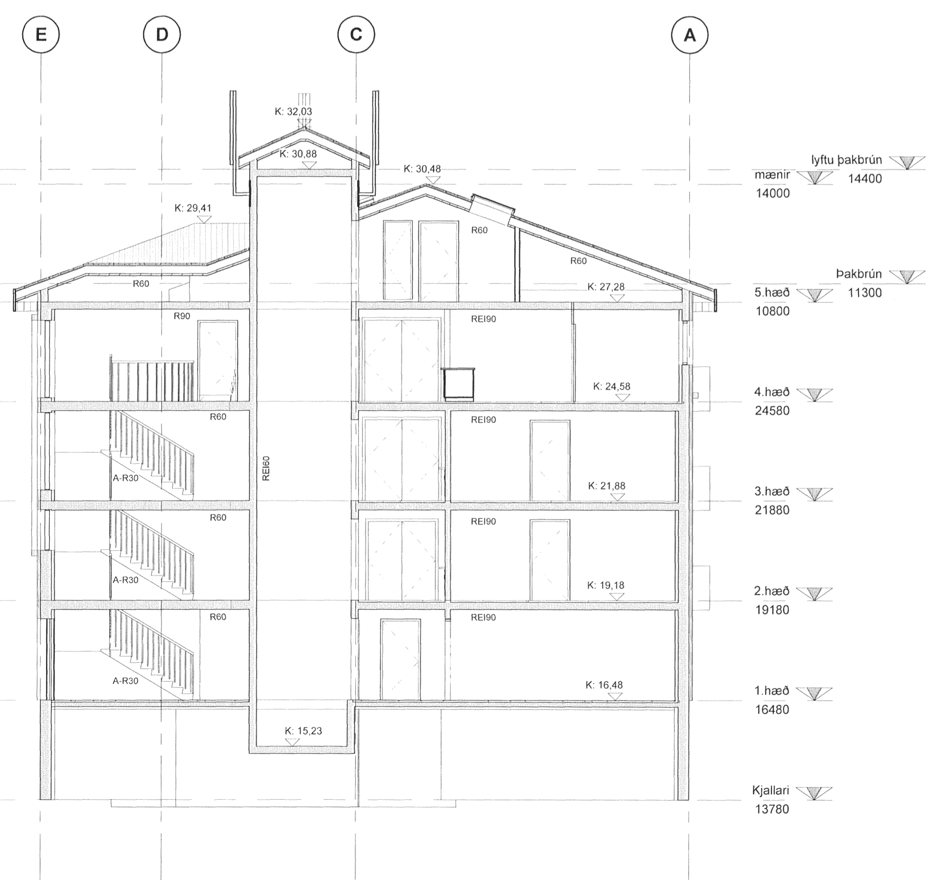
1 Snið 5 1 : 100