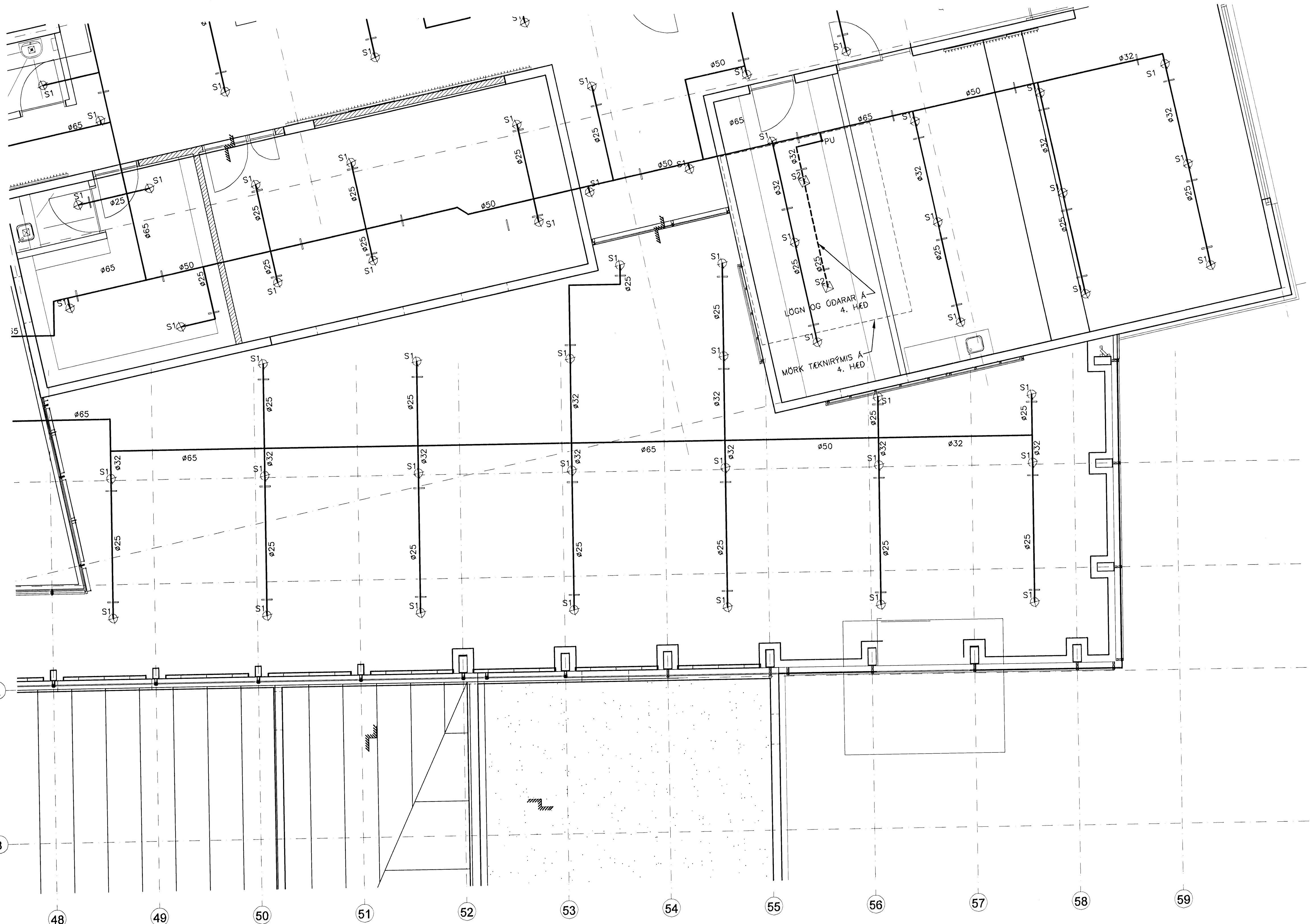
GRUNNMYND MKV. 1