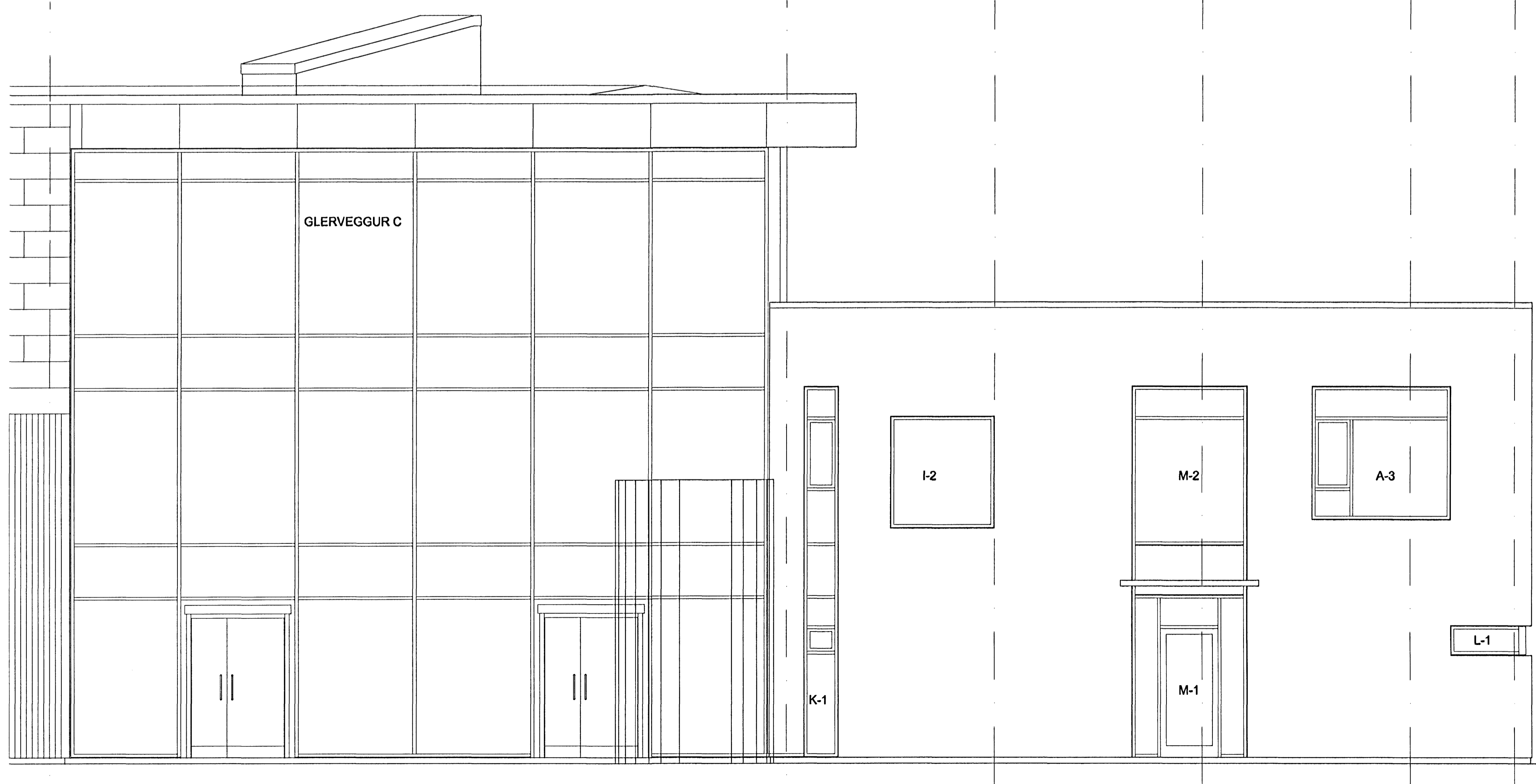
ÚTLIT TIL NORÐURS