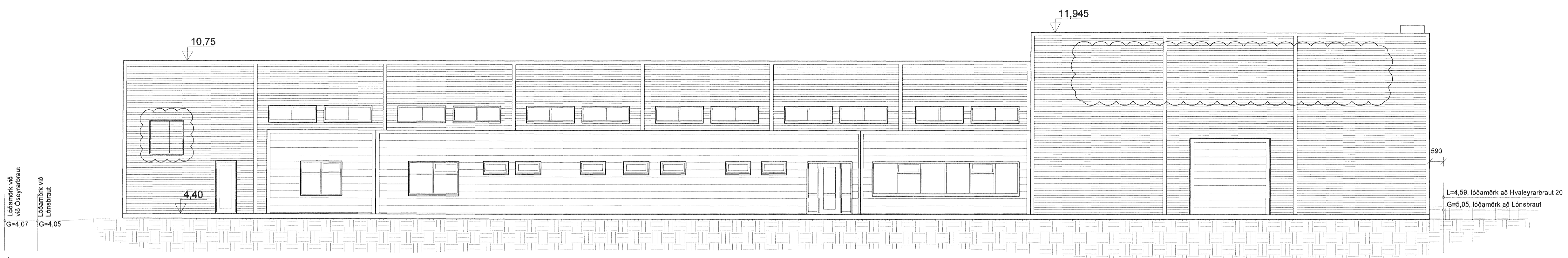
ÚTLIT SUÐVESTUR 1:100