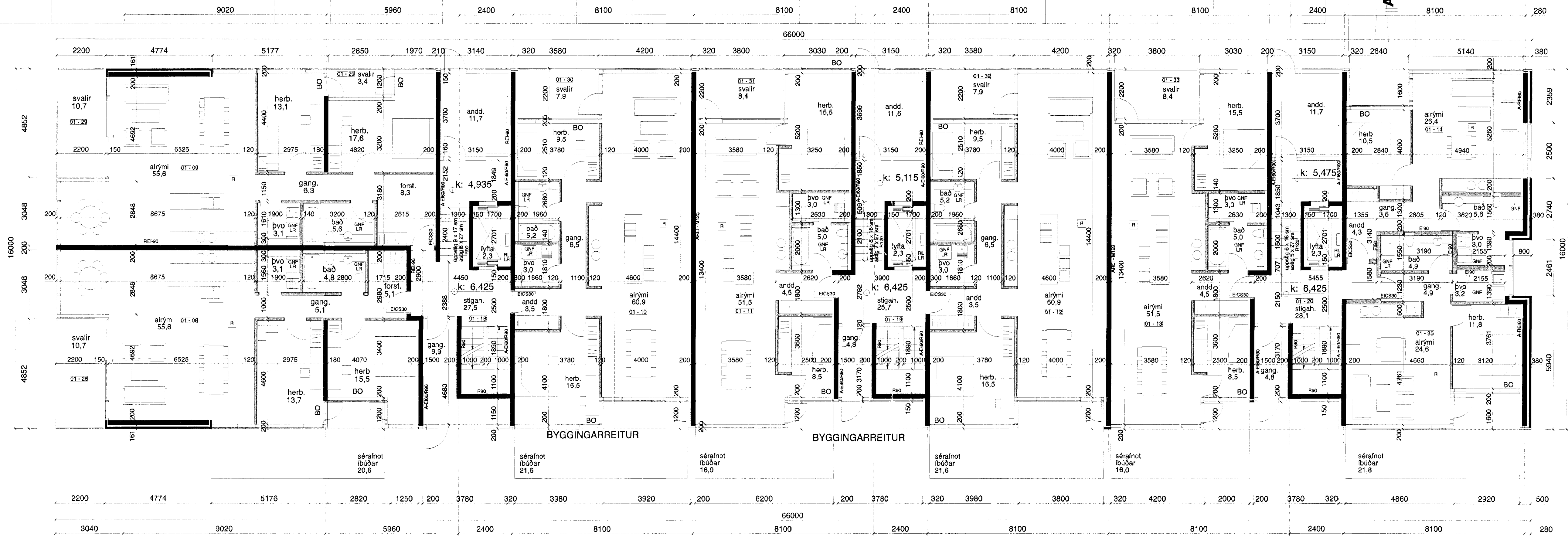
Norðurbakki 9 jarðhæð 1:100

Byggingafulltrúinn í Hafnarfirði F.h. Sigurður Steinar Jónsson