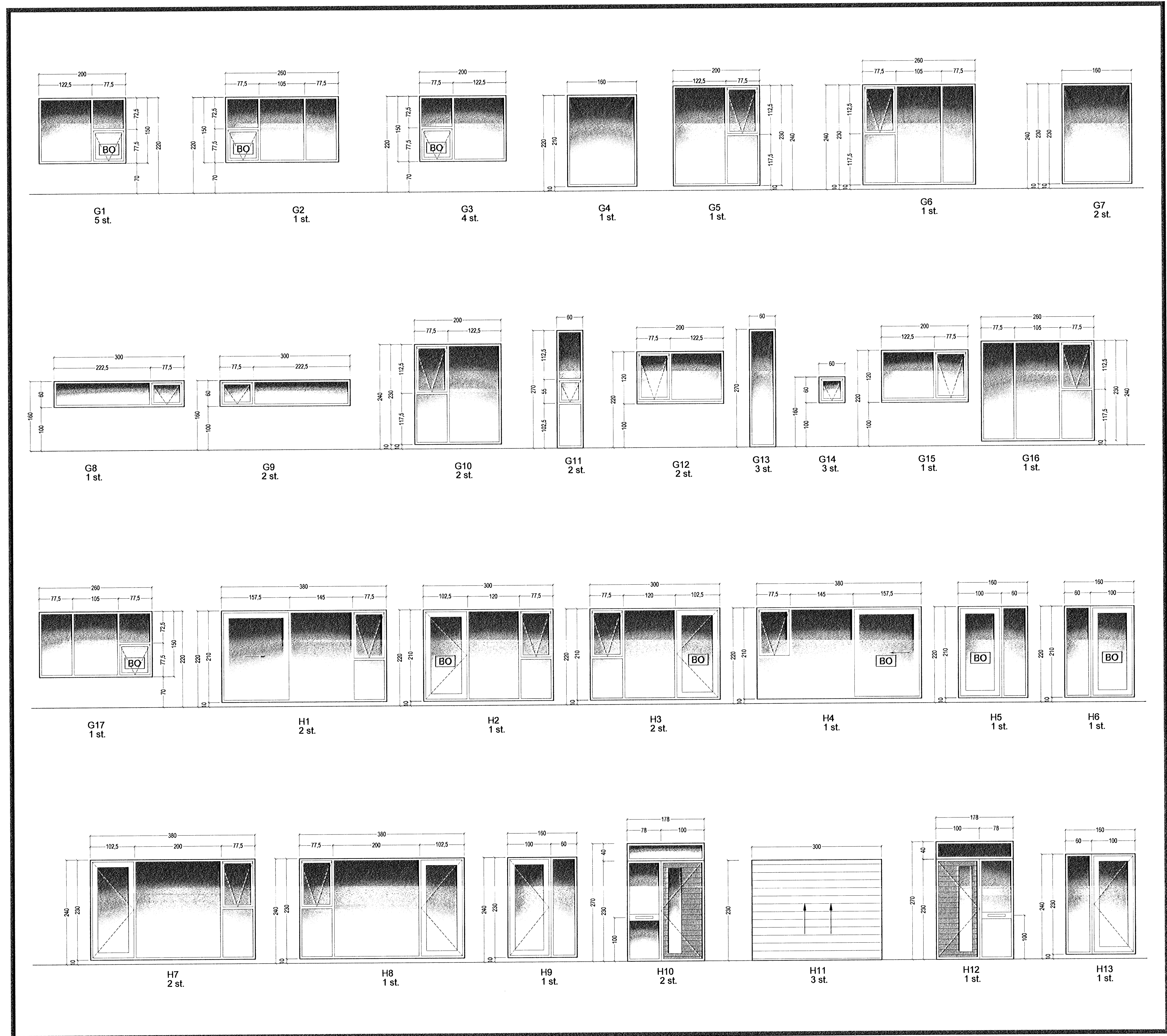
Glugga- og hurðateikning 1:50