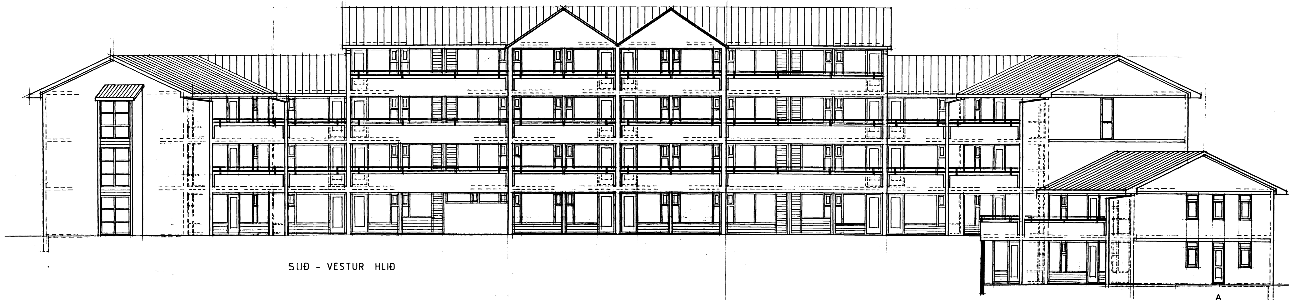
SUÐ - VESTUR HLIÐ

Sigurðir Halldór Áskildur og samþykkingarvörð