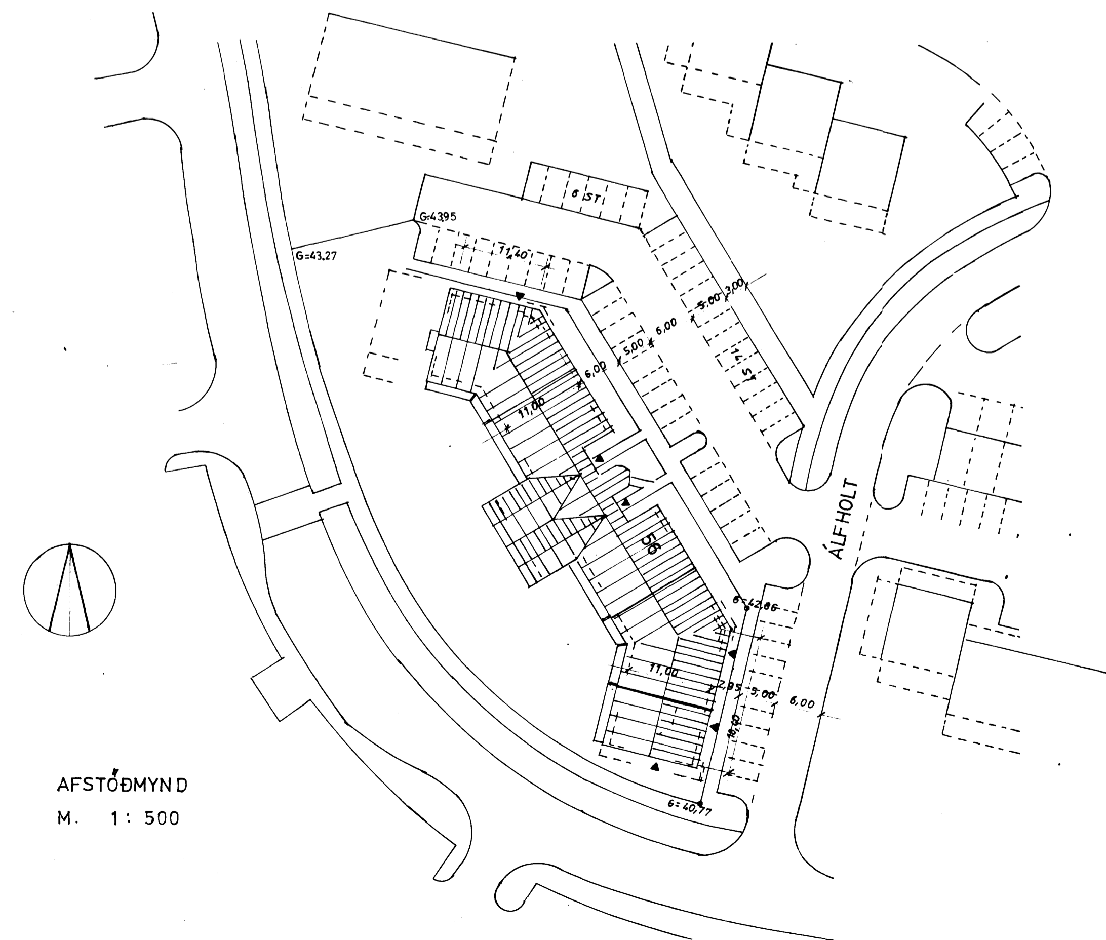
AFSTÖÐMYND M. 1: 500