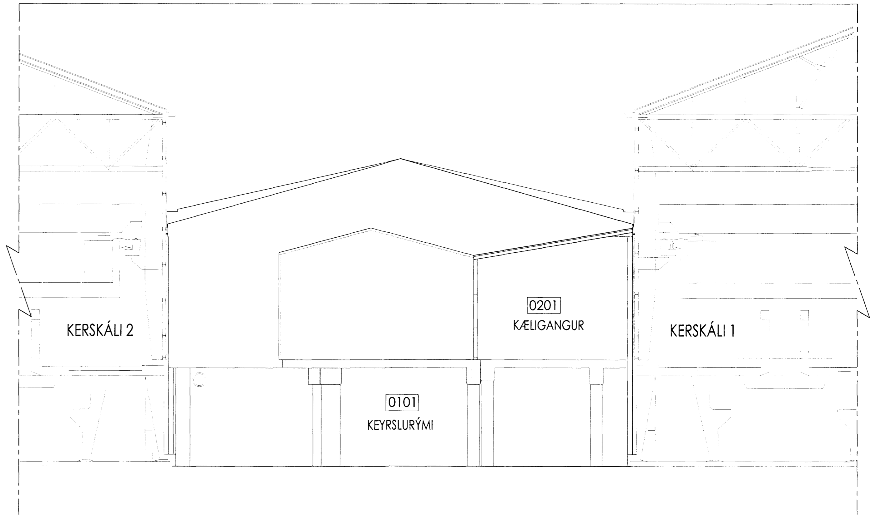
Útlit og sneiðmynd A-A MKV. 1:100

Útskýringar: Explanations: Viðbygging og breytingar á þakvirki